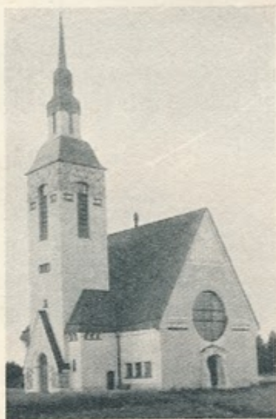
64. Terijoki. Suomalainen kirkko.