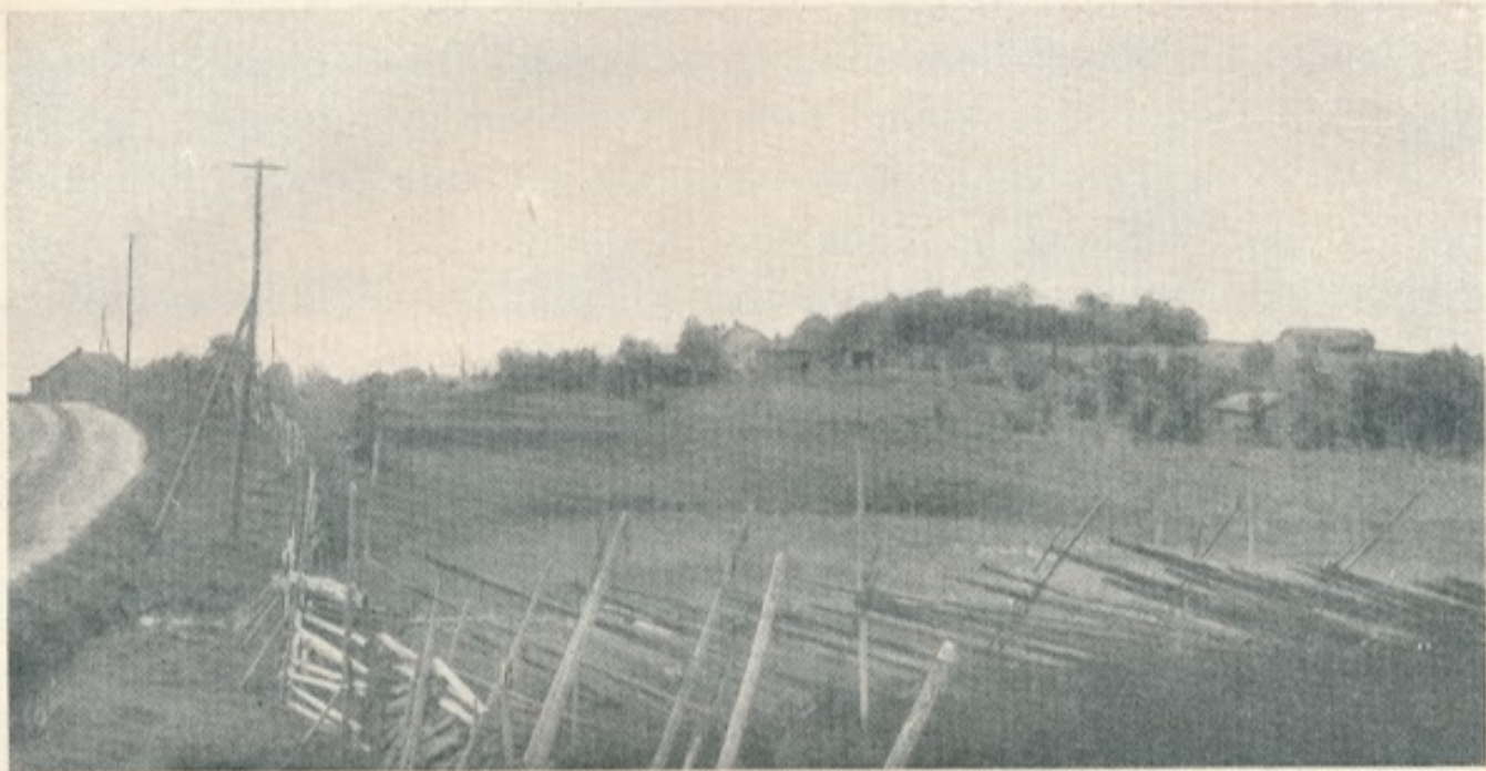
66. Kivennapa. Linnamäki.