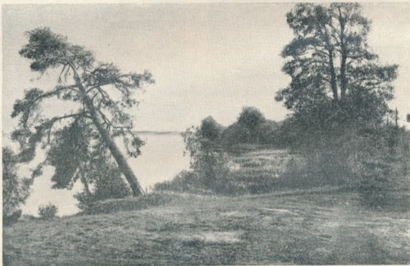
67. Muolaa. Maisema Kyyrölästä.