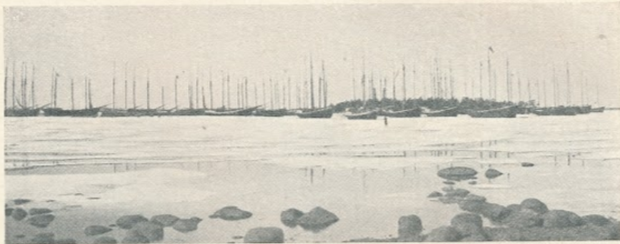
61. Lavansaari. Kalastajalaivasto satamassa.