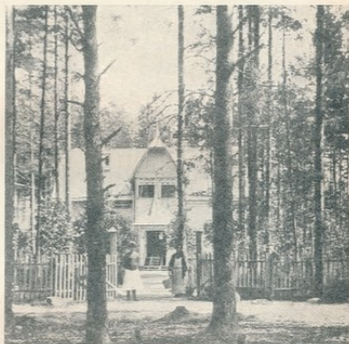
63. Uusikirkko. Huvila.