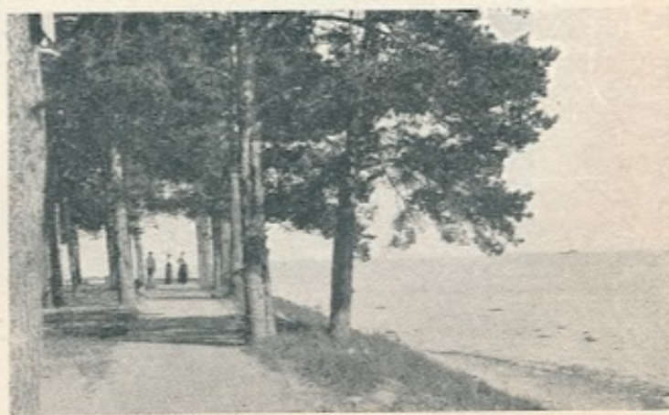
65. Terijoki. Meren rantaa.