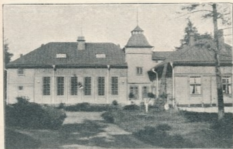
62. Uusikirkko. Kansanopisto.