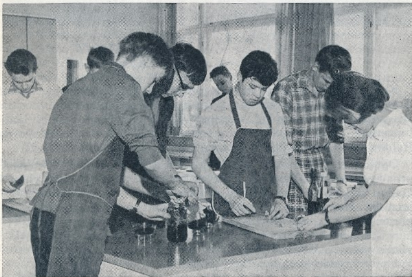
Viidennen luokan poikia kotitaloustunnilla.