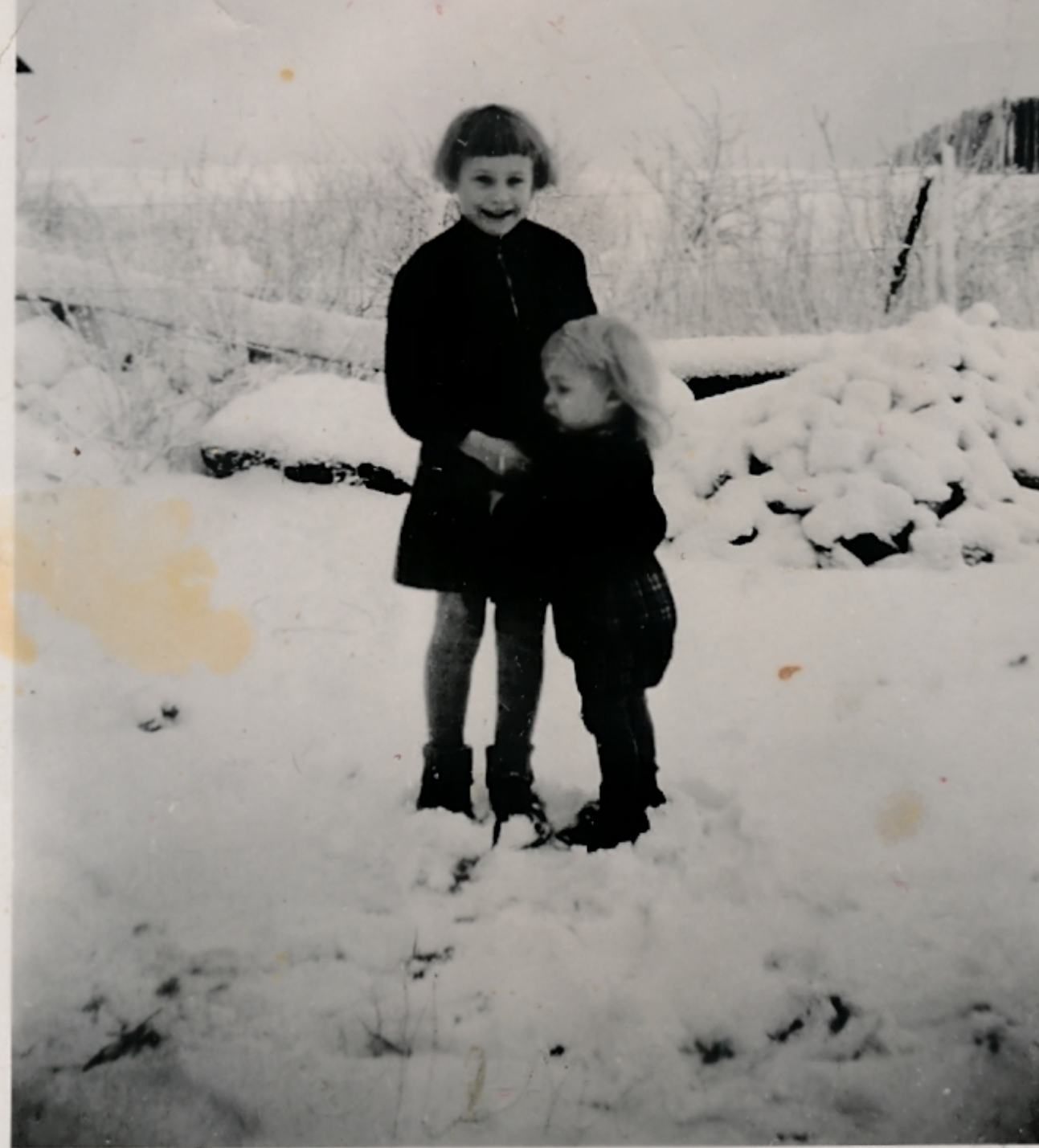
Кичинара 1944 Тине + мина