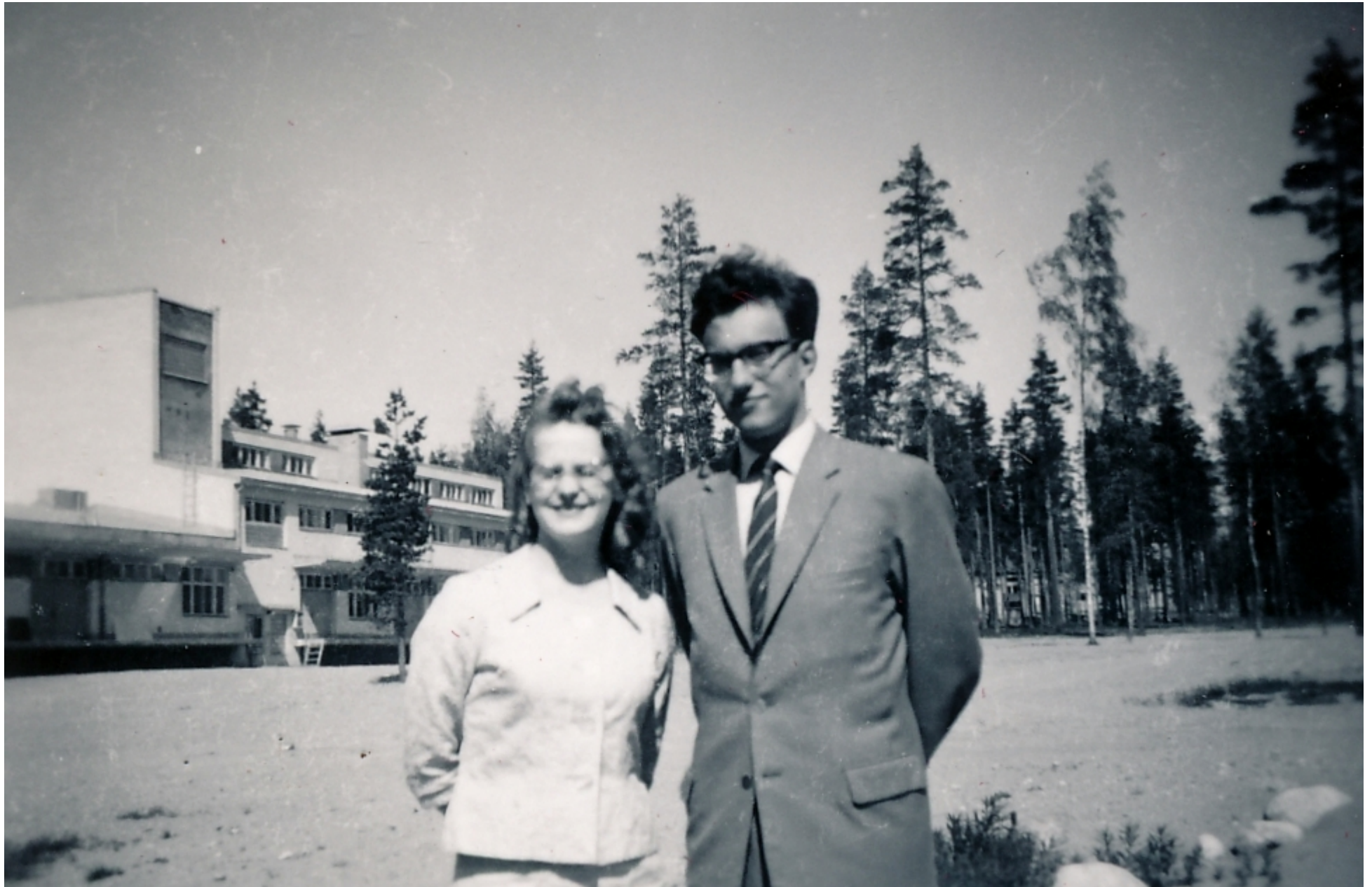
Nastola. Takana Kuivamaito Oy