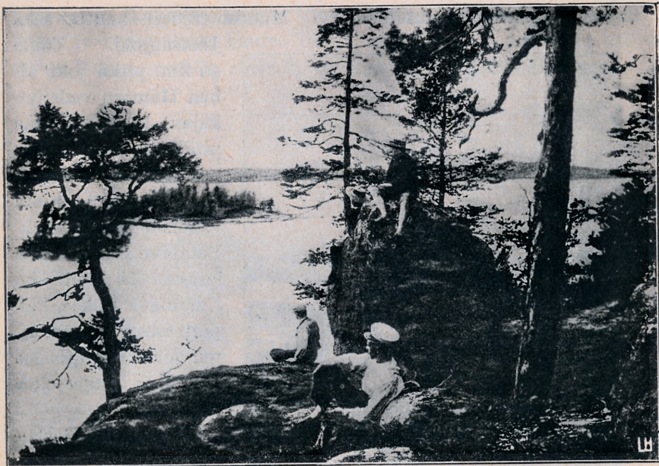
Haukkasalo Päijänteessä (Kuhmoisissa).

suuremmat ja pienemmät höyryalukset, jotka kyntävät Päijänteeseen väljiä ulapoita tai puikkelehtavat rannikon salmissa ja lahdkeissa. Järvi on eteläpäästään leveämpi ja kapenee pohjoista kohden. Sen väljin ulappa, Tehin selkä, on Sysmän ja Kuhmoisten välillä ja sen monista lahdista mainittakoon: länsipuolella Korpilahti samannimisessä pitäjässä, Juokslahti ja Tiirinselkä Jämsässä sekä Kuhmoisten ja Padasjoen lahdet, — itäpuolella Rutalahti Korpilahden pitäjässä sekä Tammilahti Luhangassa ja Sys-