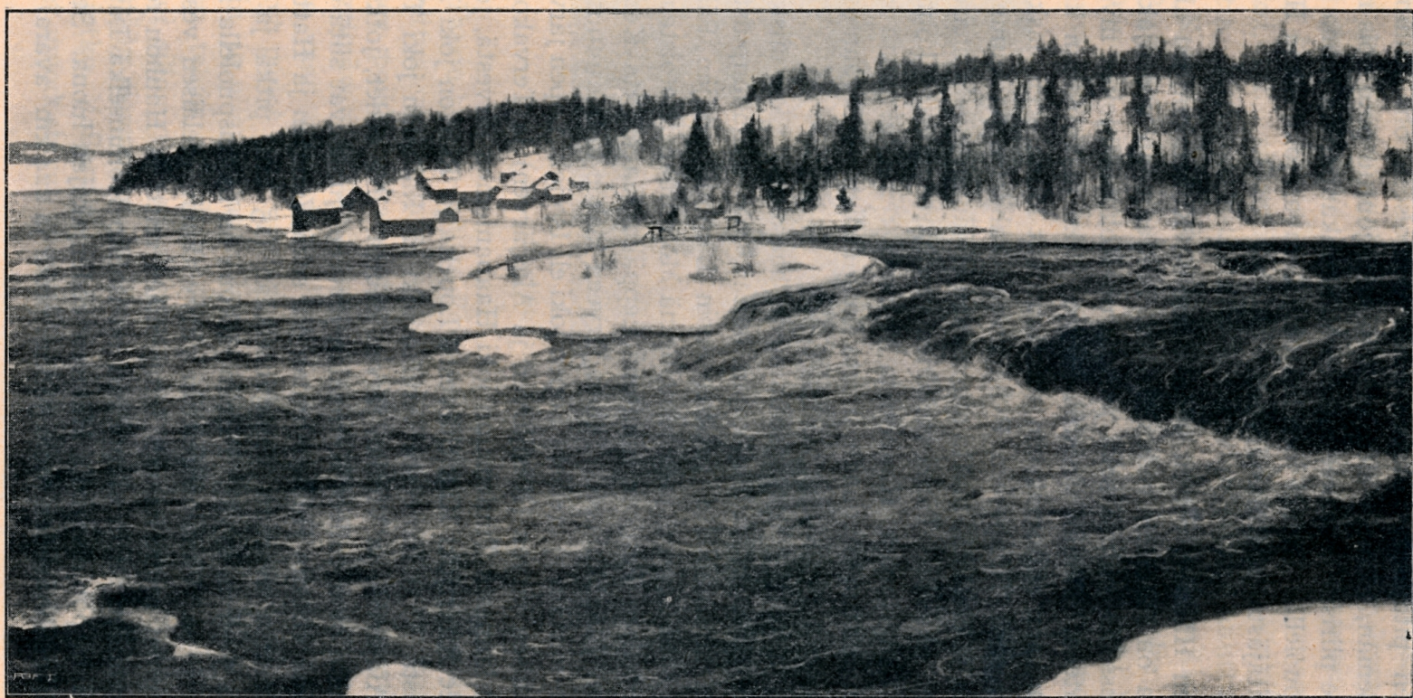
Voikkaan koski (Kyöperilän koski) Kymessä. V. Westerholmin maalaus.