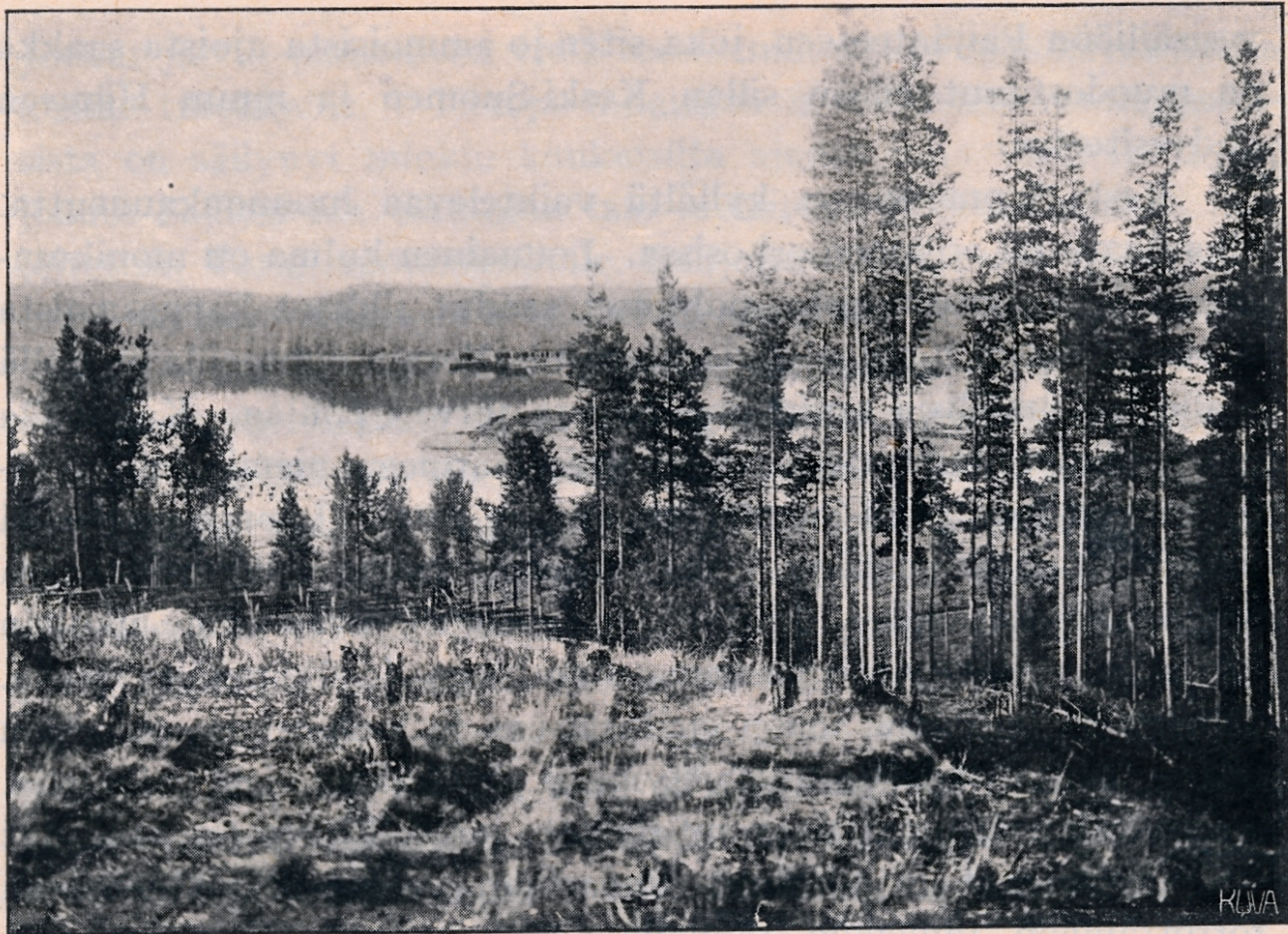
Suolahti (taustassa satamalaituri).