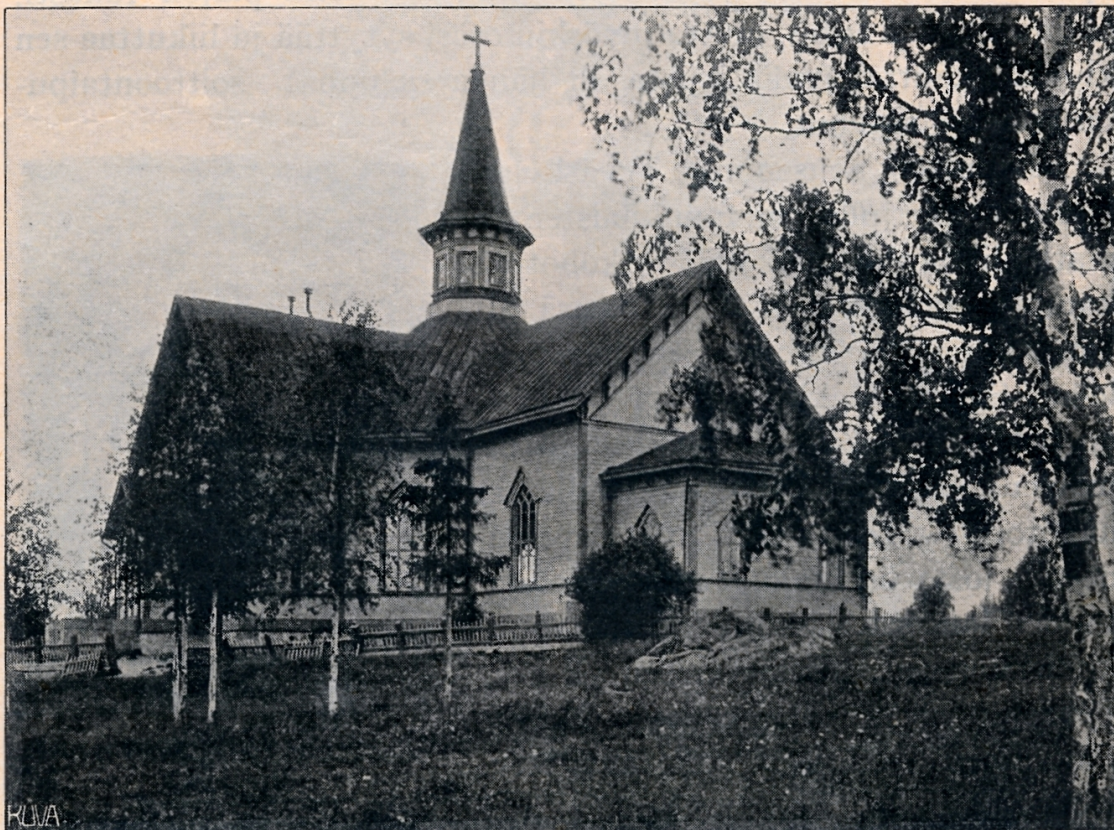
Petäjäveden uusi kirkko.

Satakunnan puolella on Keuruu. Hämeen vedenjakaja käy tässä kohden melkein yhteen maakuntarajan kanssa. Petäjävesi on sen vesistön ympärillä, jonka lasku on Jämsän joki. Tämä vesistö muodostuu kahdesta haarasta, jotka kohtaavat toisensa Petäjäveden kirkon eteläpuolella. Luoteisen haaran pääsuoni on Pengerjoki, joka tulee Satakunnan puolelta Multialta ja muodostaa lyhyellä matkalla rajan näiden pitäjien ja maakuntien väliin. Pengerjoki saa vasemmalta kaksi lisäjokea: pohjoisempi tulee pitäjän luo-