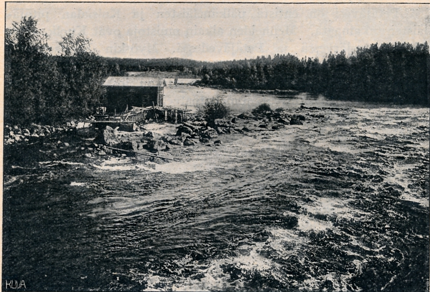
Kuusan koski (Taustassa rautatiesilta).