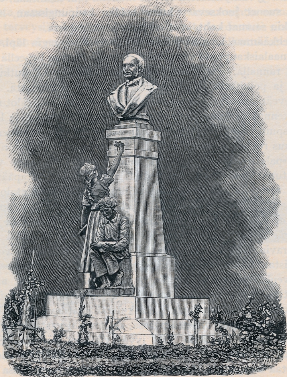
Uno Cygnæuksen muistopatsas.

jättää katsomatta, sillä siinä kohoaa v. 1900 pystytetty Uno Cygnæuksen vähäinen muistopatsas. Mikä paikka maassamme olisi-kaan tälle patsaalle sopivampi kuin se kaupunki, joka saa pitää luonaan hänen rakkaimmat luomansa.