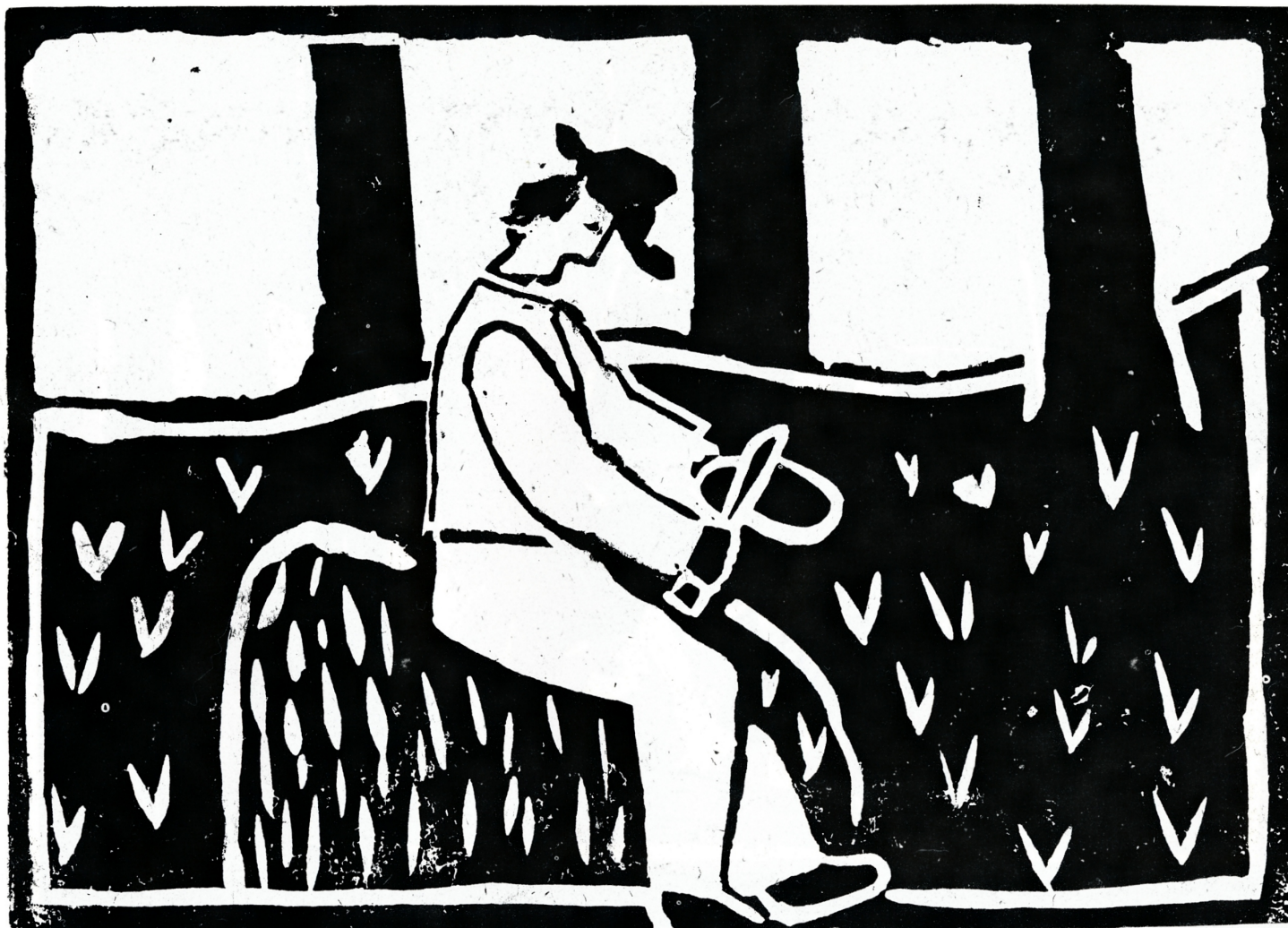
Sammon arvoitus "M.H."