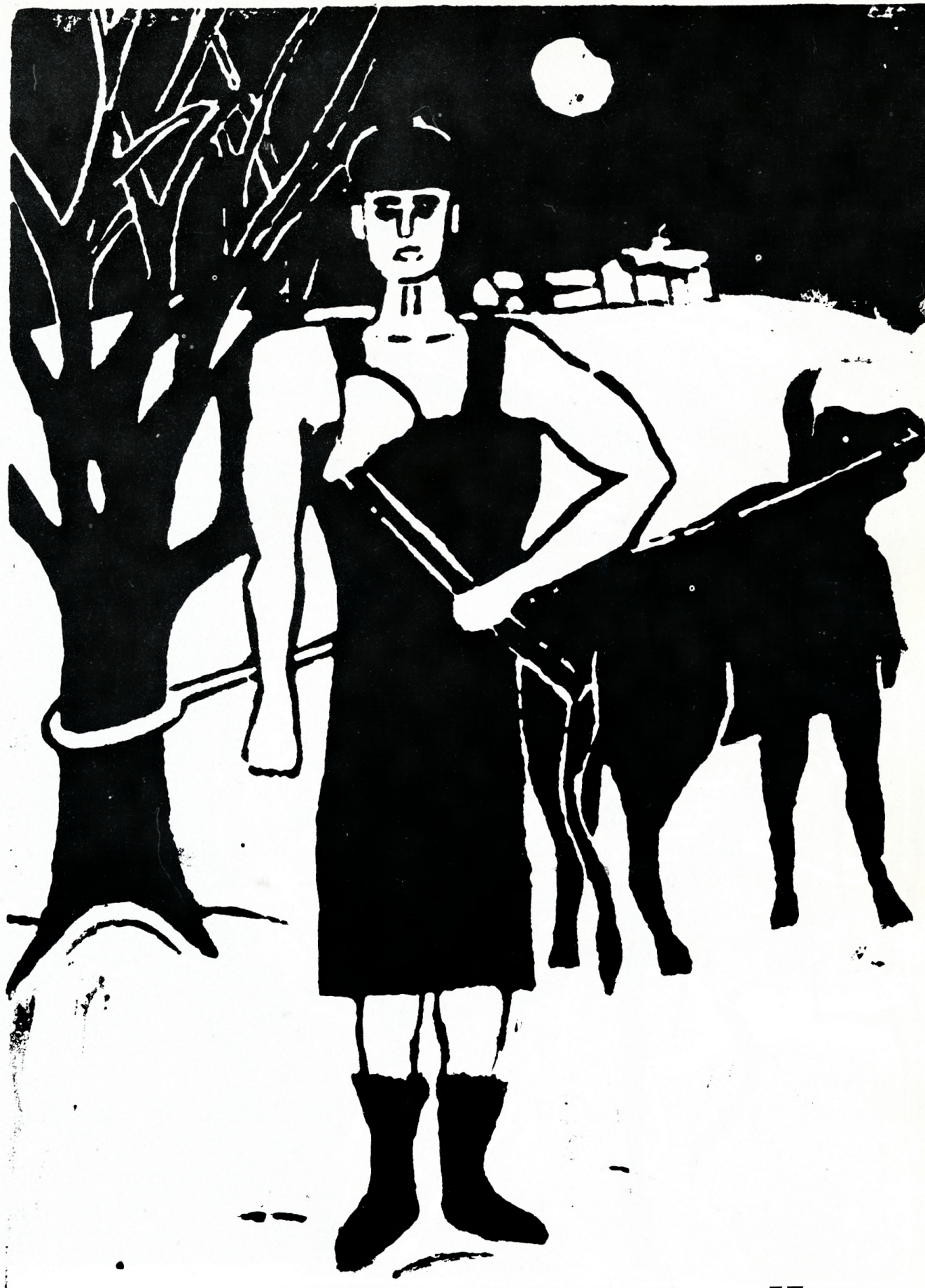
Sammon arvoitus "N.T."