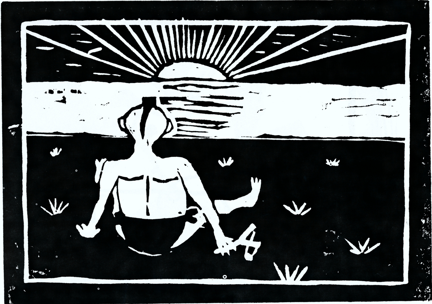
Rauhan maailma? "Rauha"