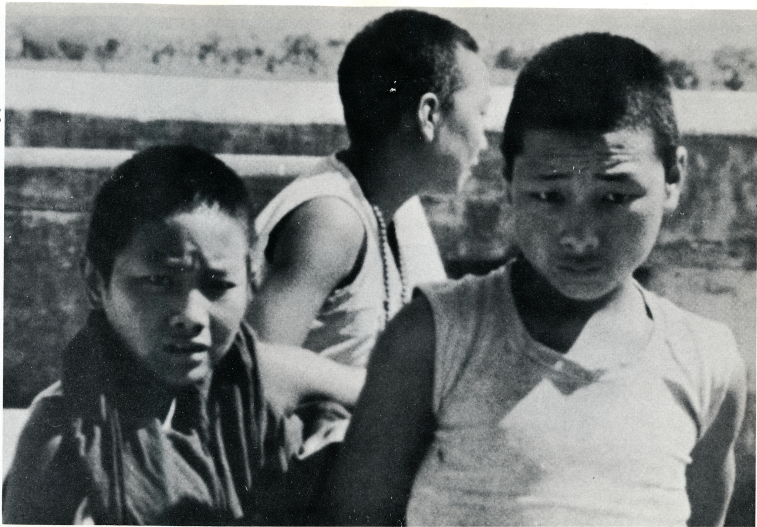
Rauhan maailma? "Ykä"