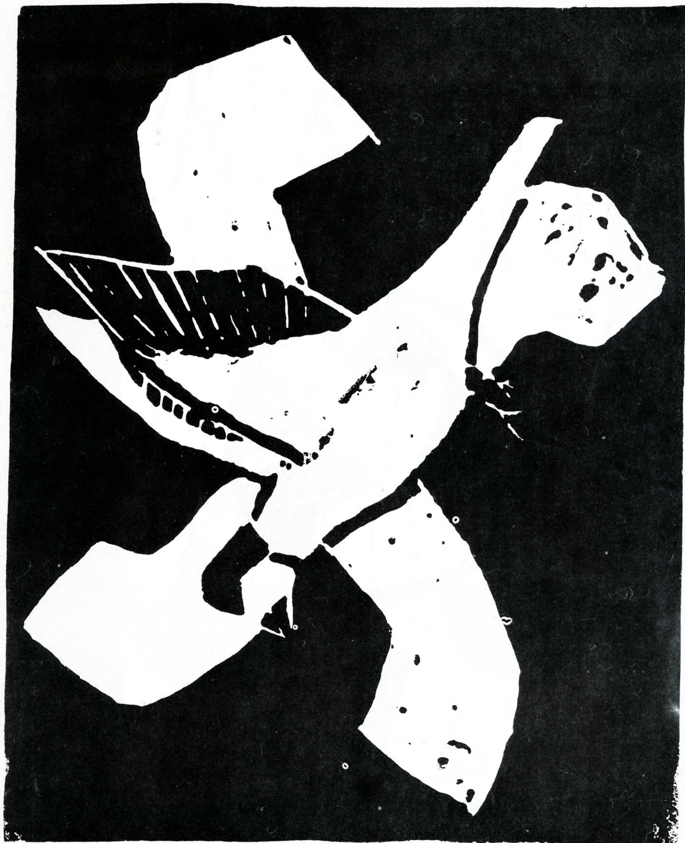
Rauhan maailma? "Rauhankyyhky"