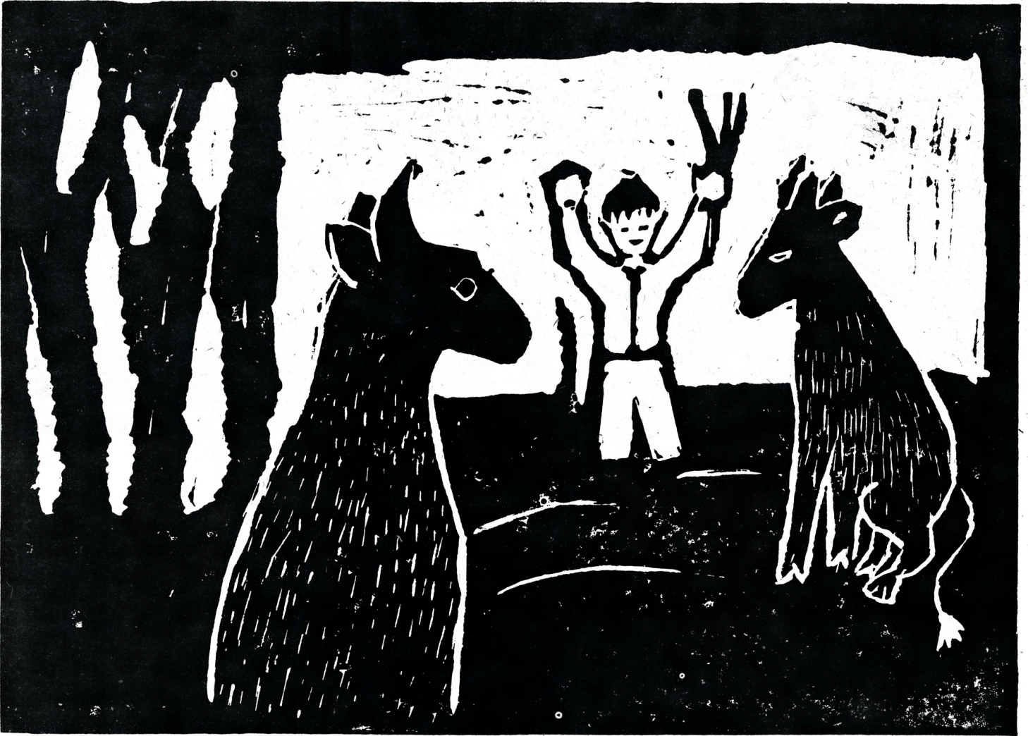
Sammon arvoitus "S.L."