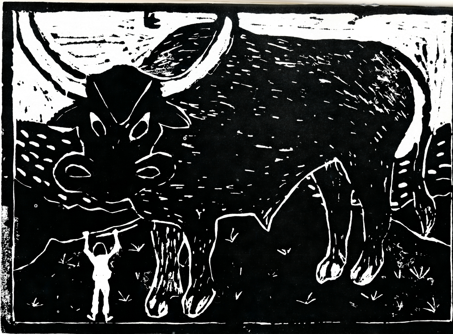
Sammon arvoitus "Iso härkä"