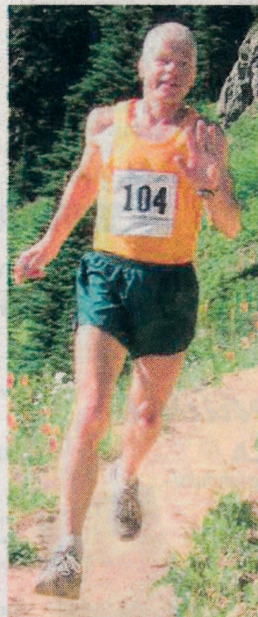
Kirjoittaja on Kannonkosken entinen kirjastotoimenjohtaja