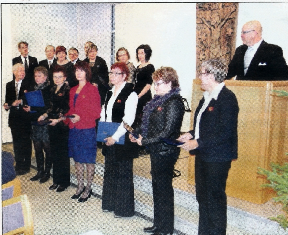
Suomen Kuntaliiton myöntämän ansiomerkkin sai moni pitkään toiminut viranhaltija ja luottamushenkilö.