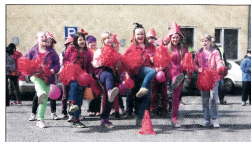
Jokaisella rallitiimillä oli oma cheerleader-porukka. Kuvan joukkue sijoittui cheerleader-kisassa kolmanneksi.