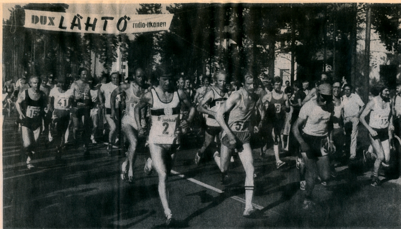
Tossut iskeytyvät ensimmäisiä kertoja asfalttiin. Edessä on 50 mailia — 80,5 kilometriä — Kesäyön Unelmaa.