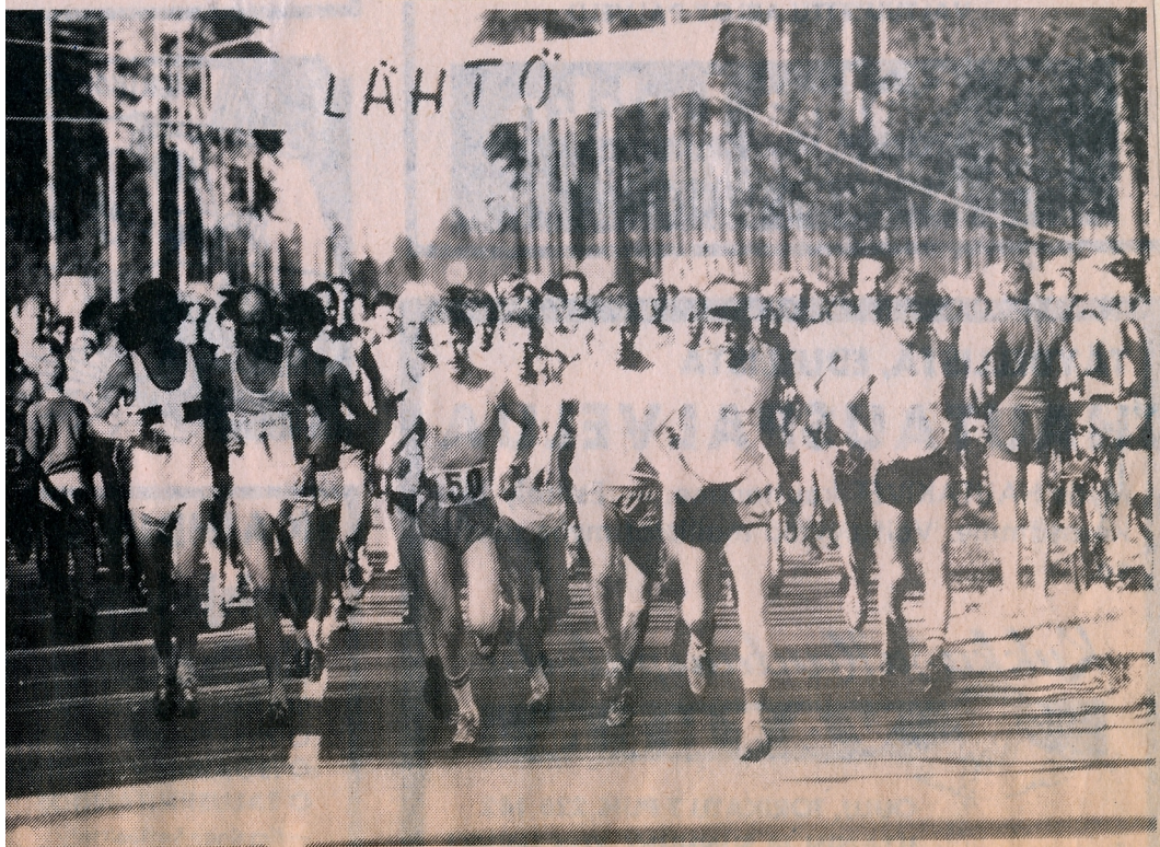
Unelmointi on alkanut.