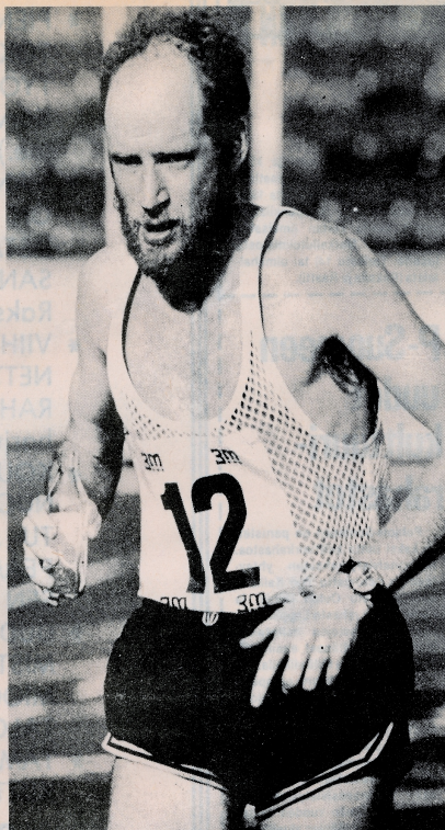
Donald Ritchie, maailman sitkein mies.