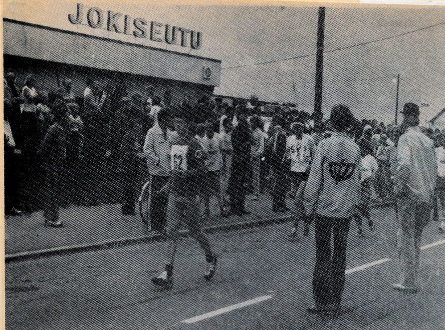
Suomi juoksee -viesti herätti Kärsämäen kirkonkylässä paikkakuntalaisten mielenkiinnon. Yleisöä oli runsaasti seuraamassa vaihtoa.