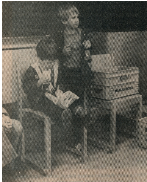
Mukana kotiseututietokilpailussa oli myös nuorempia kärsämäkisiä

Näytelmän jälkeen alkoivat tanssit, joissa musiikista vastasi kärsämäisten oma yhtye Hermes.