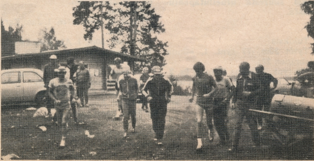
Viime sunnuntaina juoksahdettiin vielä ns. jälkihölkä, johon osallis- tui arviolta n. kolmisenkymmentä juoksijaa.