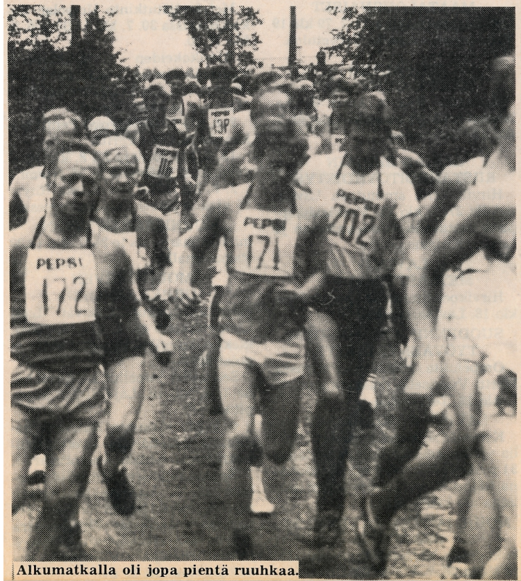
Alkumatkalla oli jopa pientä ruuhkaa.