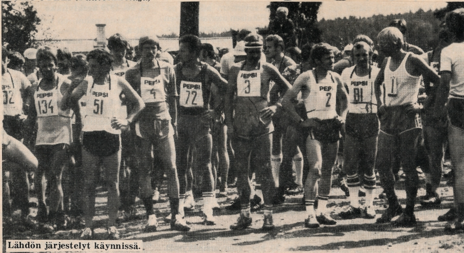
Lähdön järjestelyt käynnissä.

LAVIAN, MOUHJÄRVEN JA SUODENNIEMEN UUTIS- JA ILMOITUSLEHTI