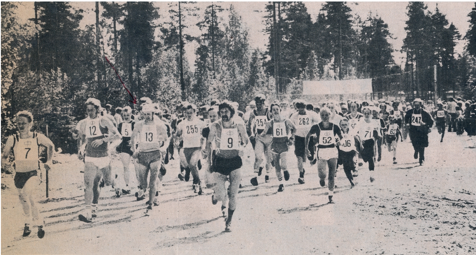
Ensimmäisen Nastola-hölkän lähtölaukaus on pamahtanut ja noin 200 kuntoilijaa on pyrkinyt matkalle. Joukon kärjessä halkovat tuulta