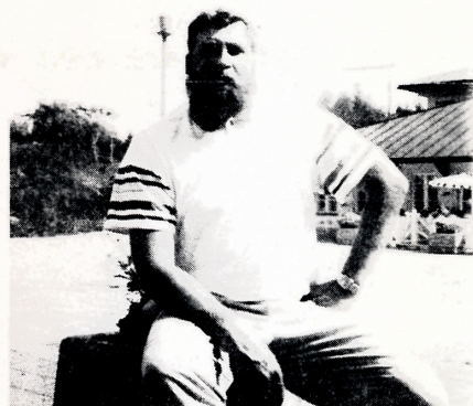
Juha Mieto ei juossut, mutta kannusti muita.