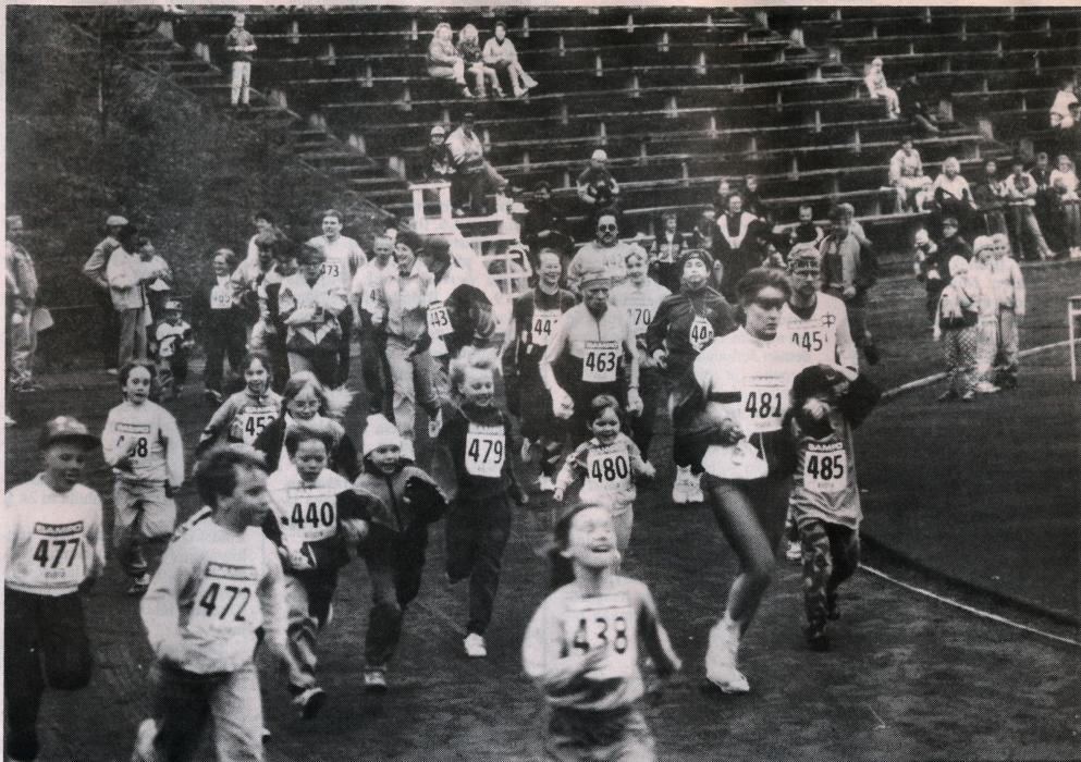
Kunniakierroksen juoksi Punkaharjulla yhteensä 37 osanottajaa, maksajia oli 171.