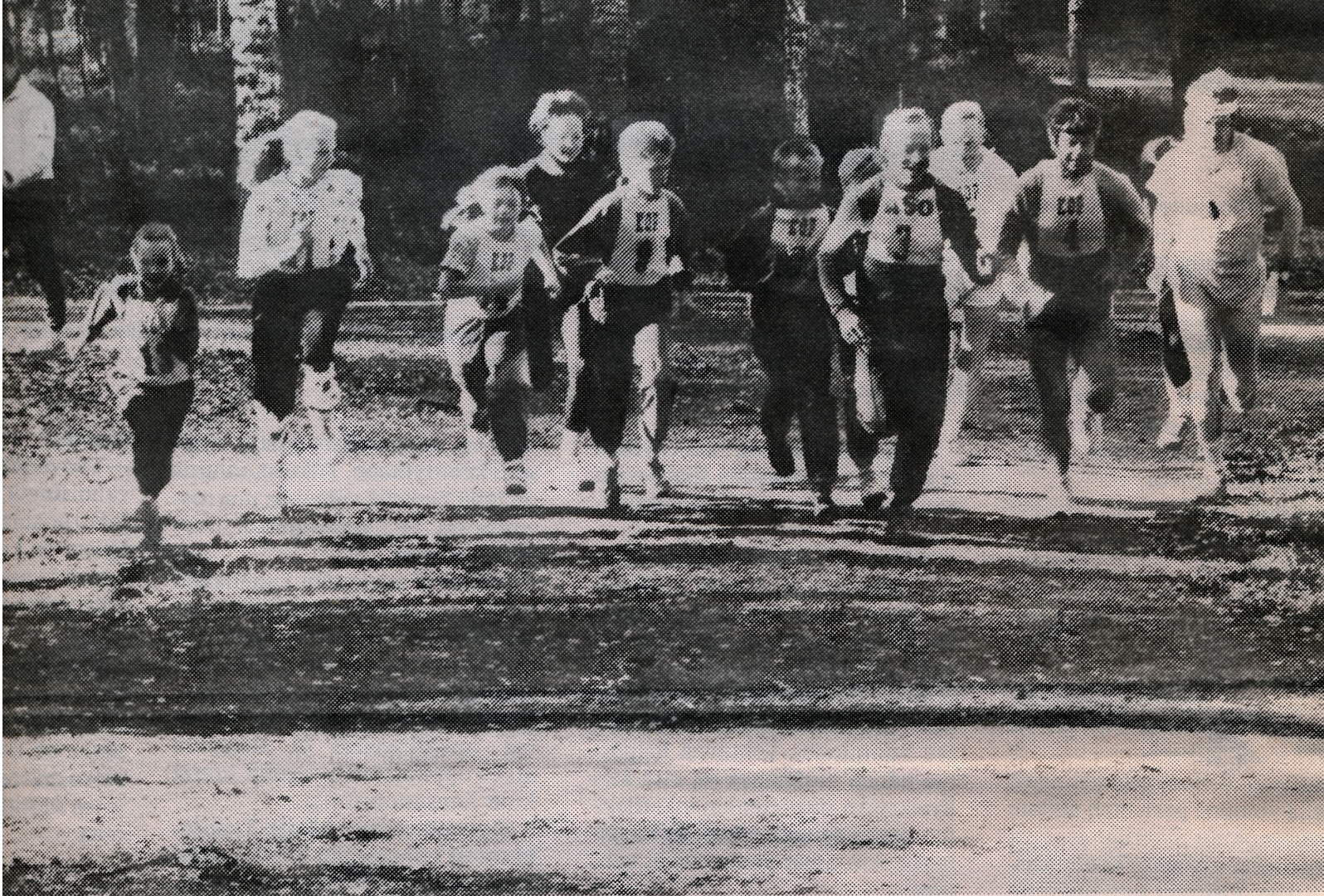
Lähtölaukaus on pamahtanut...