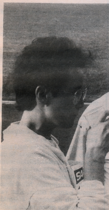
Janottihan ne kierrokset... Mehtautauolla lääkäri Kuppiine.

Tapahtuman yhteydessä oteltiin alle 10-vuotiaiden sukkulaviestitietelu. PuU:n nuoret urheilijat voittivat nippanappa Vuoriniemen Virin nuoret. Ponnien alle 10-vuotiaat eivät uskaltaneet kisaan ollenkaan. Kunniakierroksen järjestelyistä vastasivat Punkaharjun Urheilijat ja Vuoriniemen Viri.