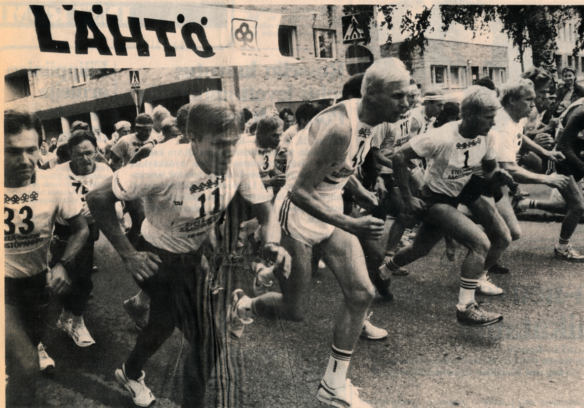
Lähdössä riitti säpinää, vaikka osanottajia olikin odotettua vähemmän.

Jukka Oopperahölkkä ei kiinnosta kuntoilijoita /tä-Savo 29.8.88 Tammisuo juoksi reittiennätyksen