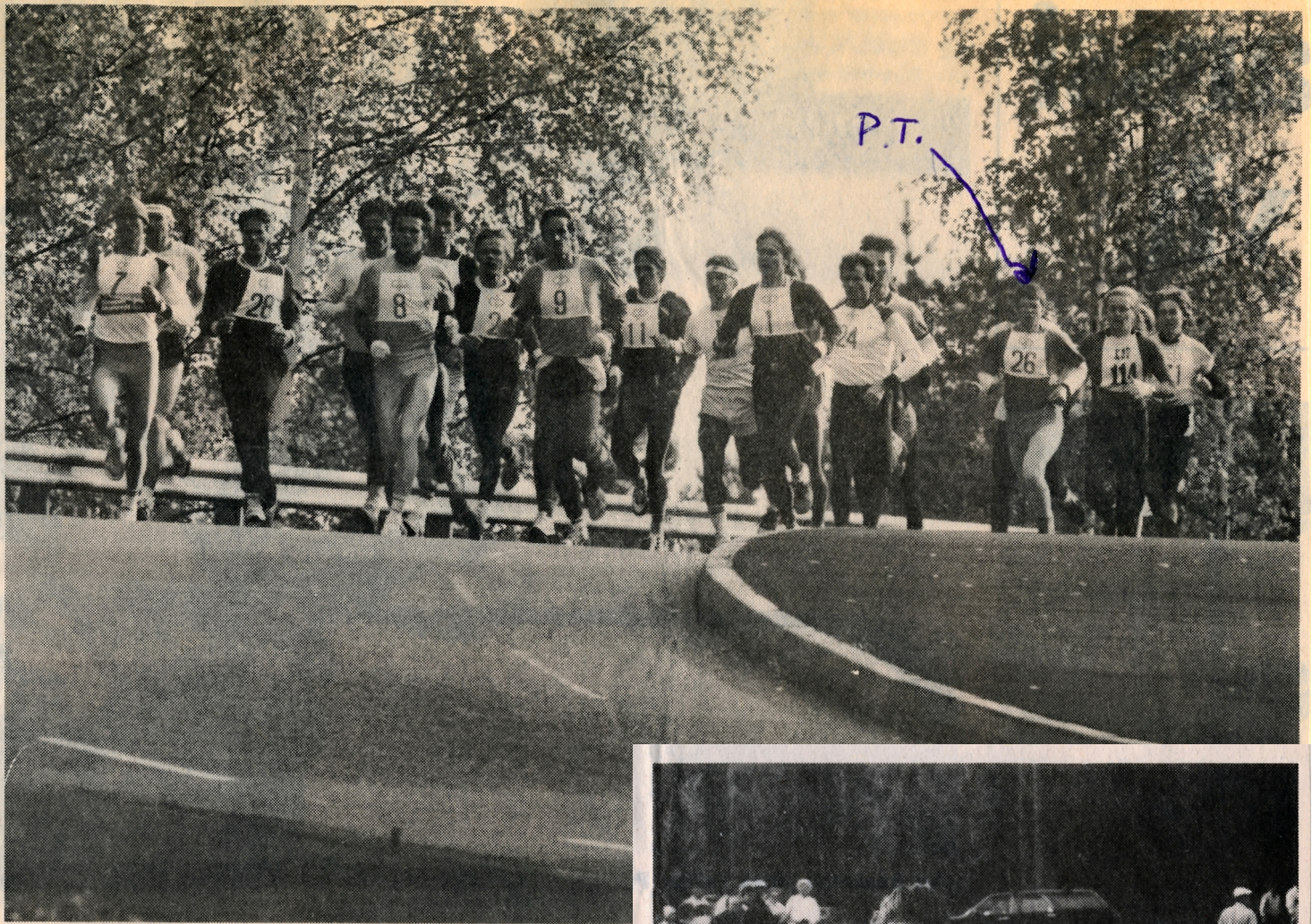
Alkumatkasta mentiin suurella joukolla sulassa sovussa.