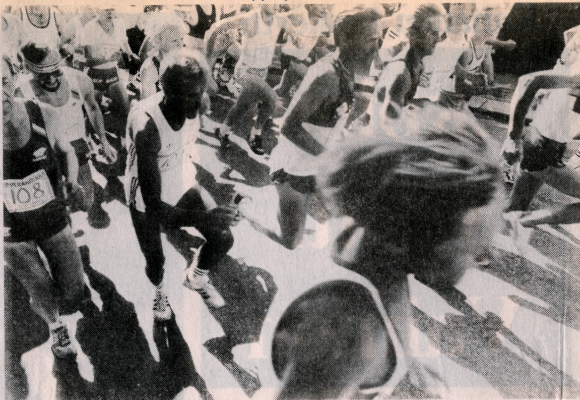
Kolmannen Oopperahölkän lähdössä riitti säpinää.