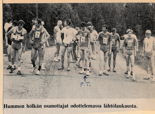
Hummon hölkan osanottajat odottelemassa lähtölaukausta.

'huvikseni' ilmoitin. Olin mukana perustamassa sitä v. 1981.