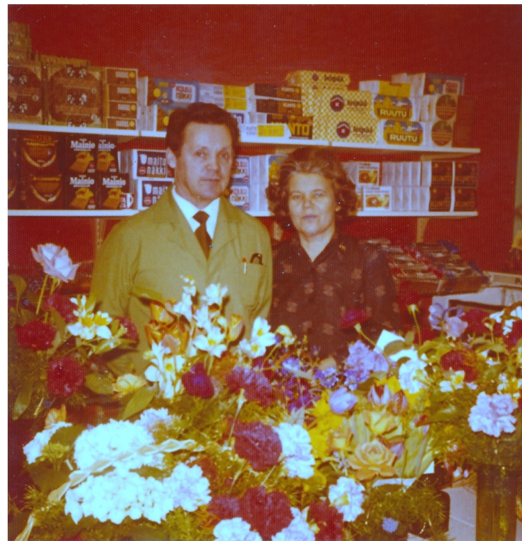
Kauppa 20 v. 1.4.1975