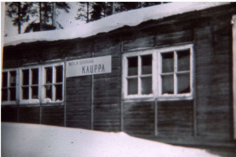
Maito ja sekatavara kauppa. Tästä se alkoi 1.4.1955.