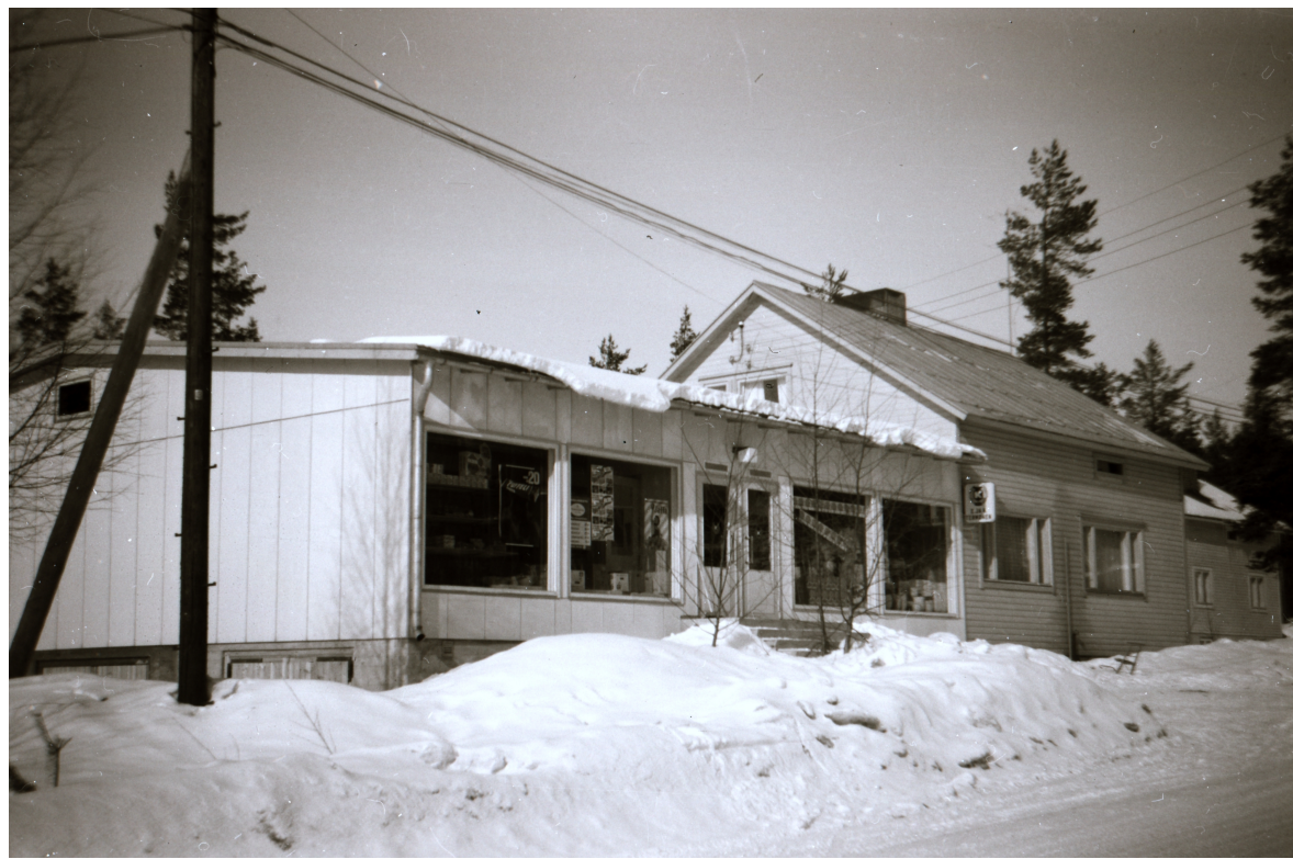
Kauppaa parannettiin ja laajennettiin monta kertaa