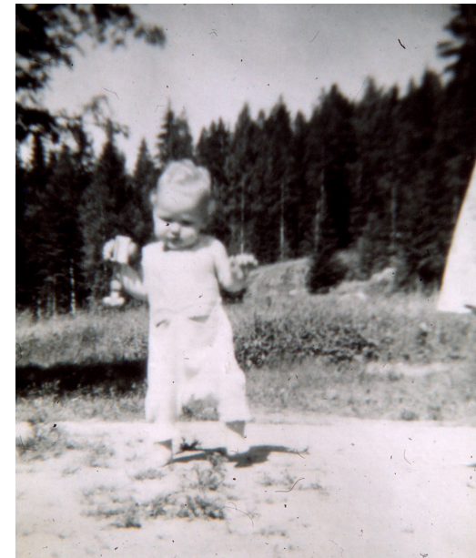
Matin ensi askelia. Rauta- lampi, Sillankorva. v. 1954