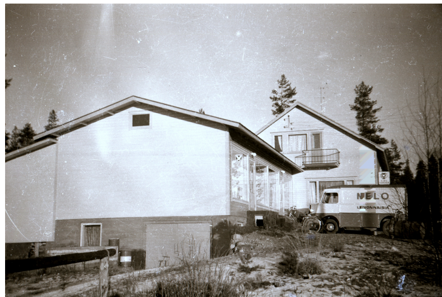
Pihassa Nelon auto