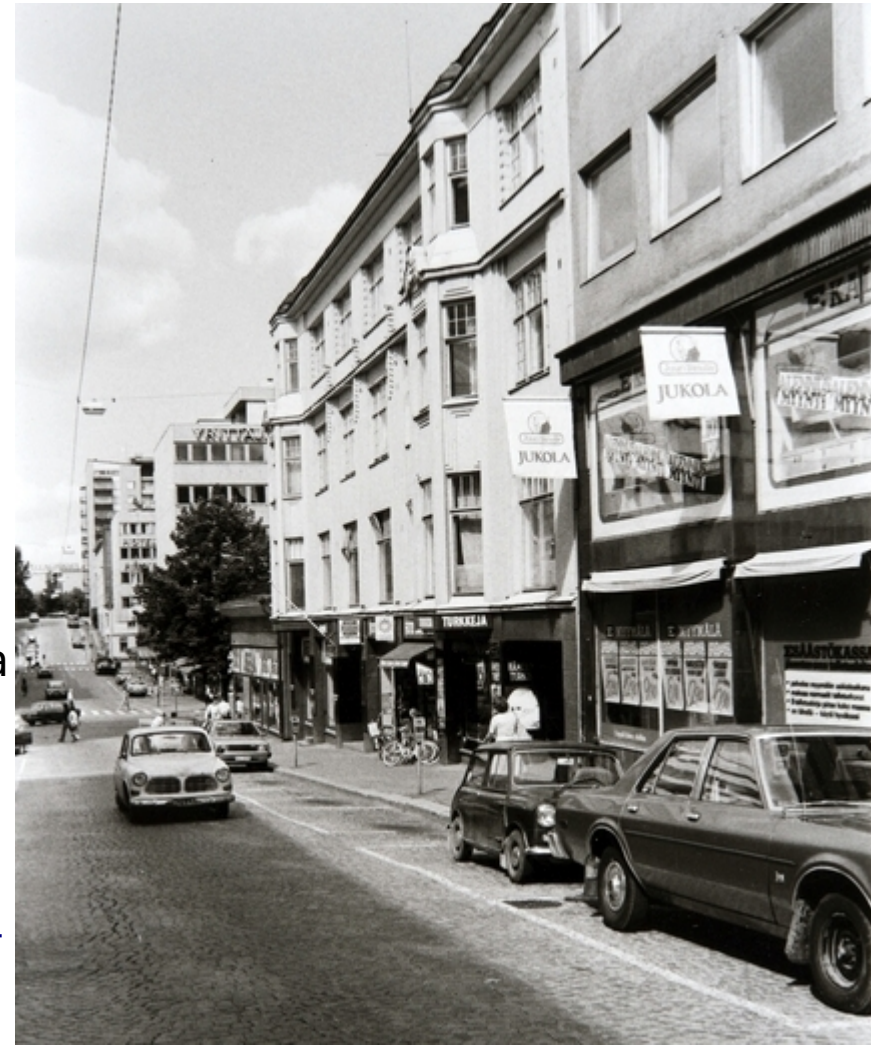
Rautatienkatu. Lahti. Hotelli/ravintola Jukola alhaalla Aleksanterinkadun kulmassa. n. v. 1970.