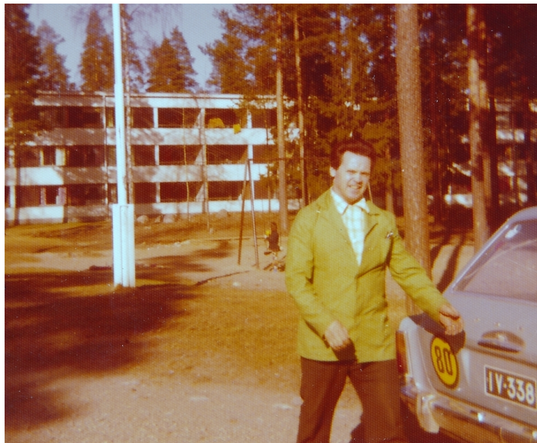
Kotiinkuljetusta Niinirinteellä. Kolmas auto oli Ford Taunus (IY-338).