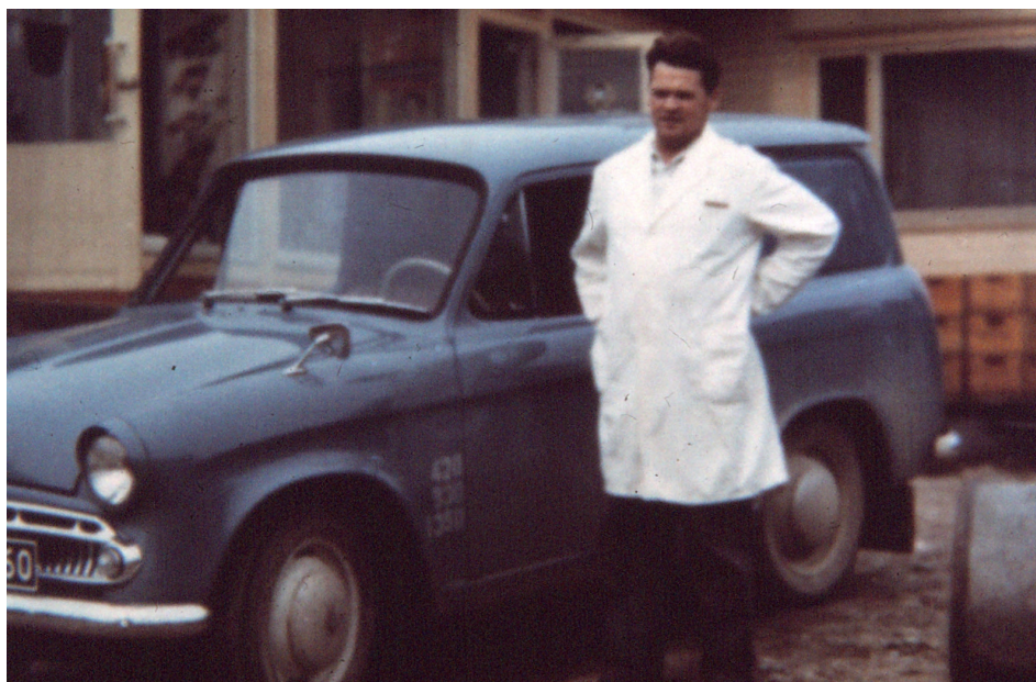
Ensimmäinen auto oli Commer Cob (HHG-60) Ennen autoa kotiinkuljetus suoritettiin kolmipyöräisellä polkupyörällä.