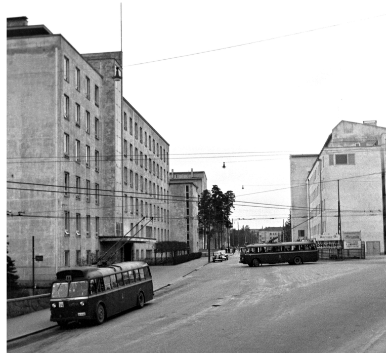
Haartmaninkatu 2, 1. - Topeliuksenkatu 30. Vas. Naisten- klinikka, oik. Työterveyslaitoksen talo. Helsingin kaupungin- museum. Kuva: Eino Heinonen

2.7. "Klo 19.00 Naistenklikalle Elleniä tervehtimään sekä nuorimpaa poikaani katsomaan... Ehkä meillä vielä on tyttöjäkin... [Anne Marie Helena syntyi 9.3.1959 samaan