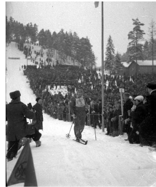
Salpausselä 1947. Museokeskus Vapriikki.

22.5. "Jälleen Lahdessa hammaslääkärin vastaanotolla." Sisämaa 24.5.1947