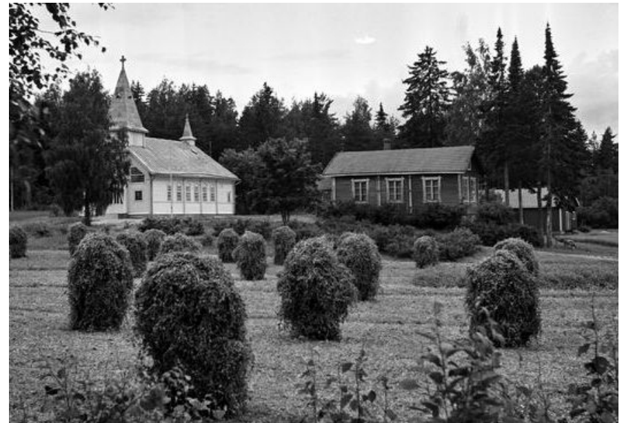
Vuonna 1904 valmistunut Mommilan kartanon kirkko.