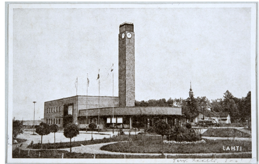
Lahden linja-autoasema. V. 1946 lähetetty kortti.