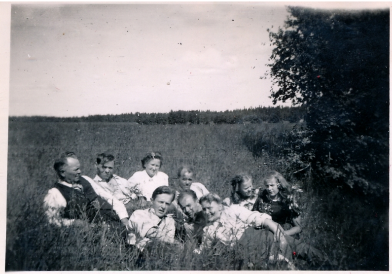
Ullavan mitzellä häit- ten järeisnä päivänä.