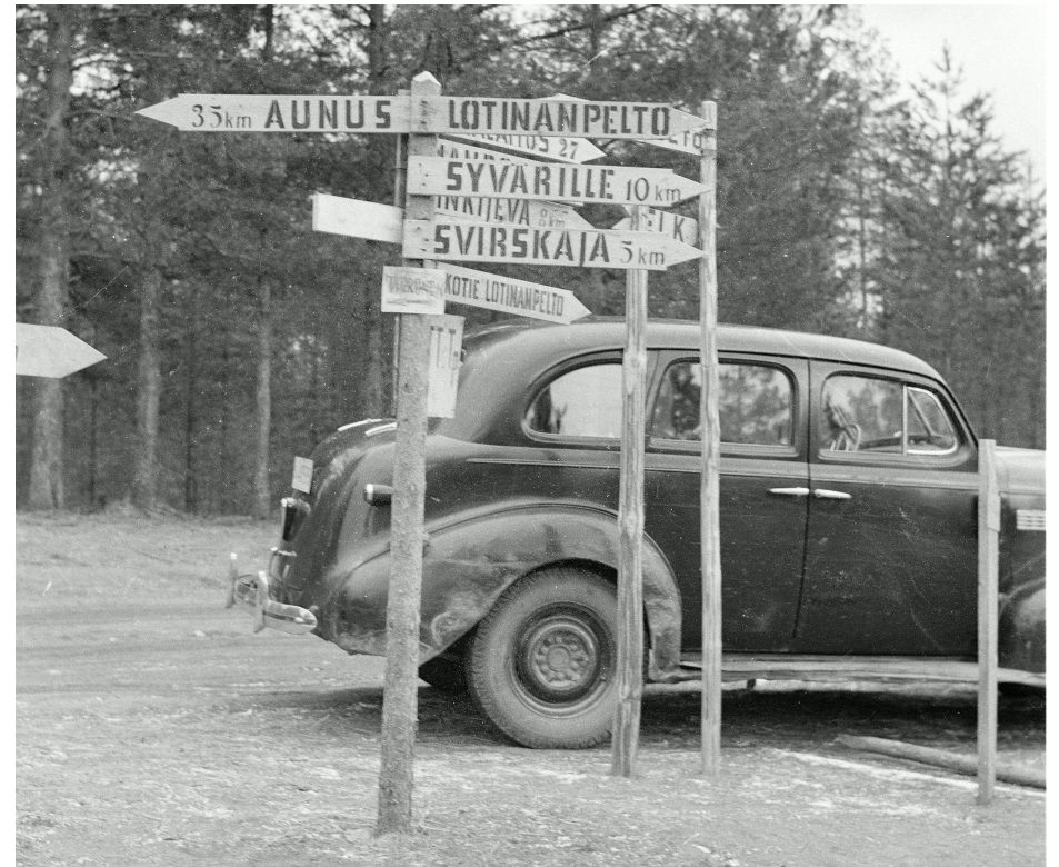
Tienviitta Lotinanpellolle päin. Aunus 20.4.1942.