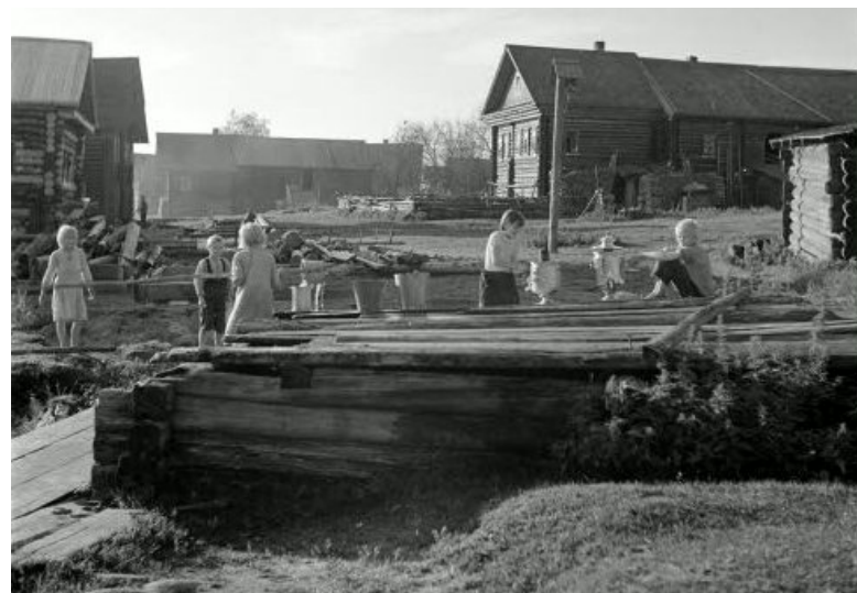
Kaivolla pestään samovaareja.

2.3. "Tänään aamulla klo 6.30 lähdettiin Pienselästä suksilla Kuittisiin, josta autoilla Nurmoilaan. Klo 11 olimme perillä... olen 'ammatiltani' tästä lähtien taist.lähetti." Laatokka 3.3.1942