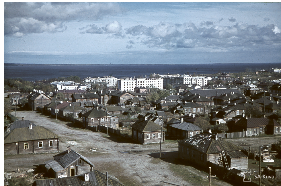
Äänislinna hyppyrimäen tornista 17.10.1941.