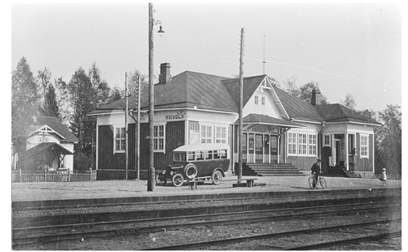
Raivolan asema 1920-30-luku.

26.12. "Tapaninpäivä... Päivä kului rauhallisesti, mutta ilta muodostui pieneksi sodaksi. Me mentiin kavereiden kanssa klo 17 tykistön kanttiinin katsomaan elokuvaa 'Hätävara'. Heti sieltä palattuamme alkoi tilanne, ryssät alkoi ammuskella tykeillään." Laatokka 31.12.1942