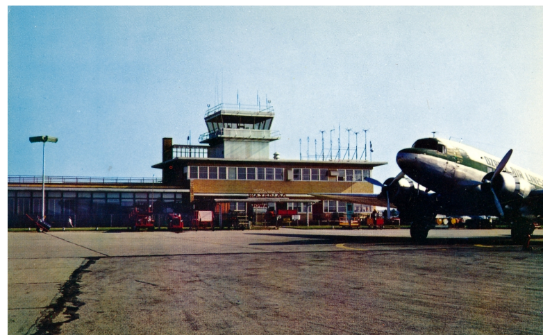
Airport serving Waterloo and Cedar Falls