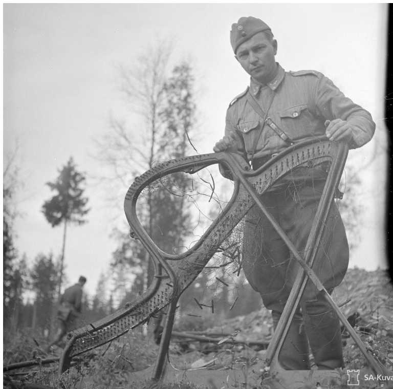
TK-mies kirjailija Matti Kurjensaari virkaveljensä Olavi Paavolaisen kodin raunioilla Kivennavan kirkonkylässä, 10.10.1941.