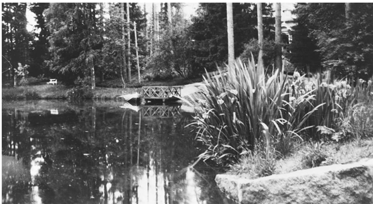
Kurjenmiekat kukkivat kirjailija Olavi Paavolaisen puutarhassa Kivennavalla, 1930-luku.