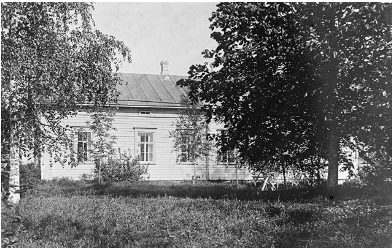
Linnamäen pappila, 1930-luku.