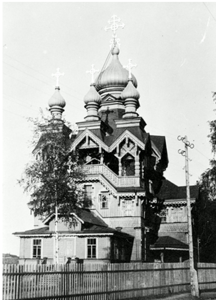
Raivolan ortodoksinen kirkko, 1910-30-luku.