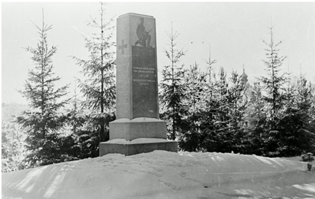
Raivolan vuoden 1918 sankaripatsas, 1920-30-luku.