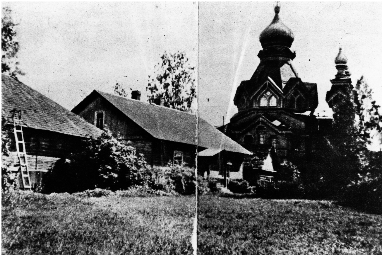
Edith Södergranin koti Raivolassa (1910-1940).