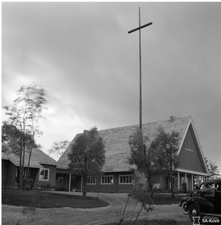
Kivennavan uusi kirkko päivää ennen vihkiäisiä 25.9.1943.