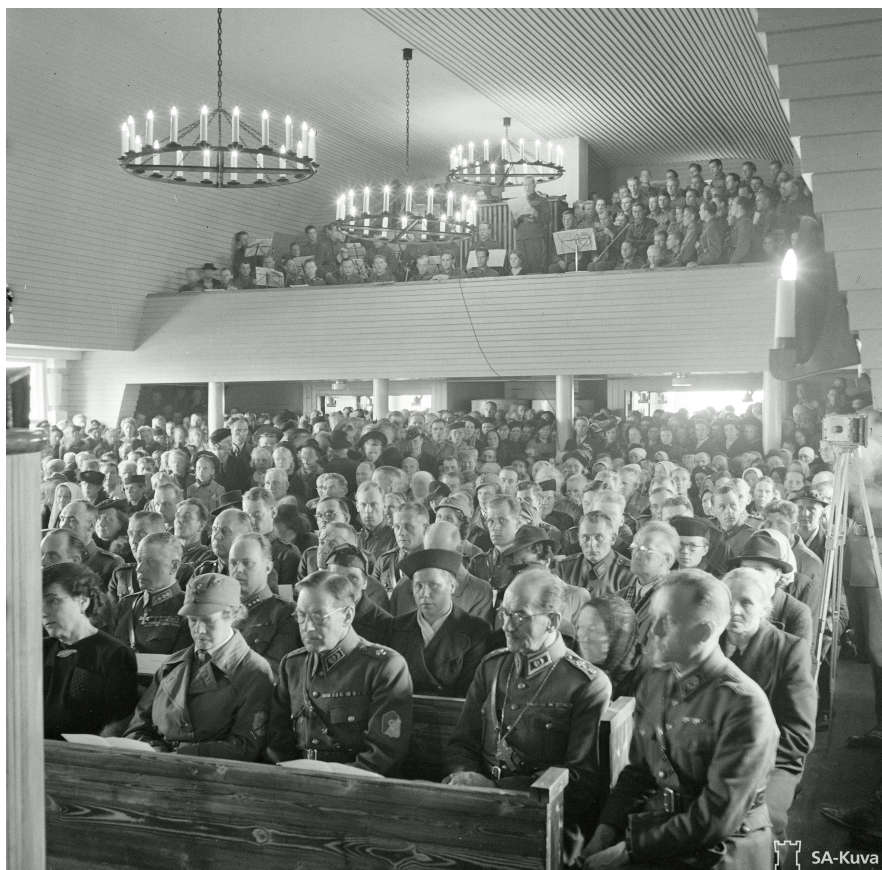
Kivennavan uuden kirkon vihkiäiset 26.9.1943.