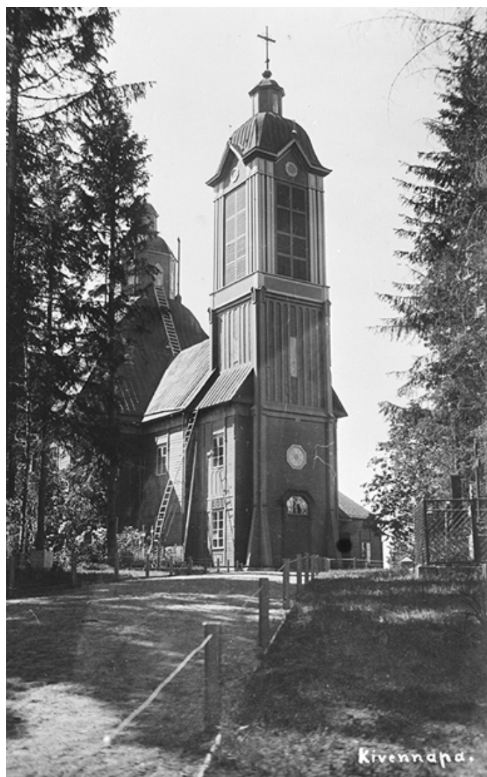
Kivennavan vuonna 1808 valmistunut luterilainen kirkko vihittiin Pietarin päivänä 29.6.1812. Talvisodan alettua 30.11.1939 suomalaiset joukot polttivat sen vetäytyessään 1.12.1939. 1930-luku.