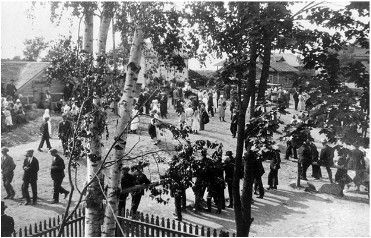
Kihut Kivennavan kirkonkylässä, 1920-30-luku.