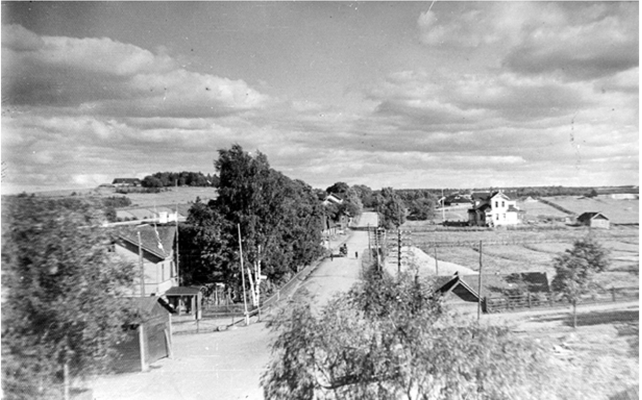
Kivennavan kirkonkylä, taustalla Linnamäki ja pappila, 1920-30-luku.