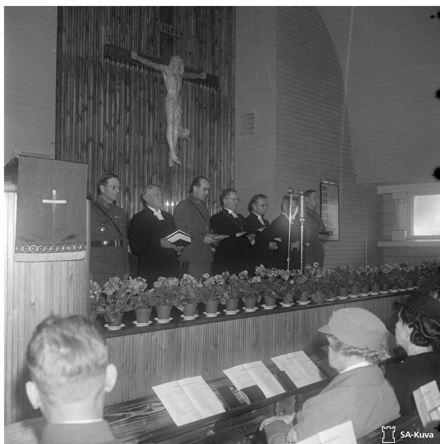
Kivennavan uuden kirkon vihkiäiset 26.9.1943.