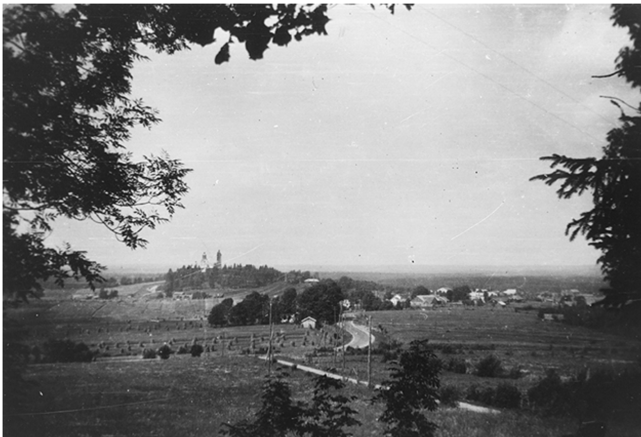
Kivennavan kirkonkylää Linnamäeltä 1920-30-luku.