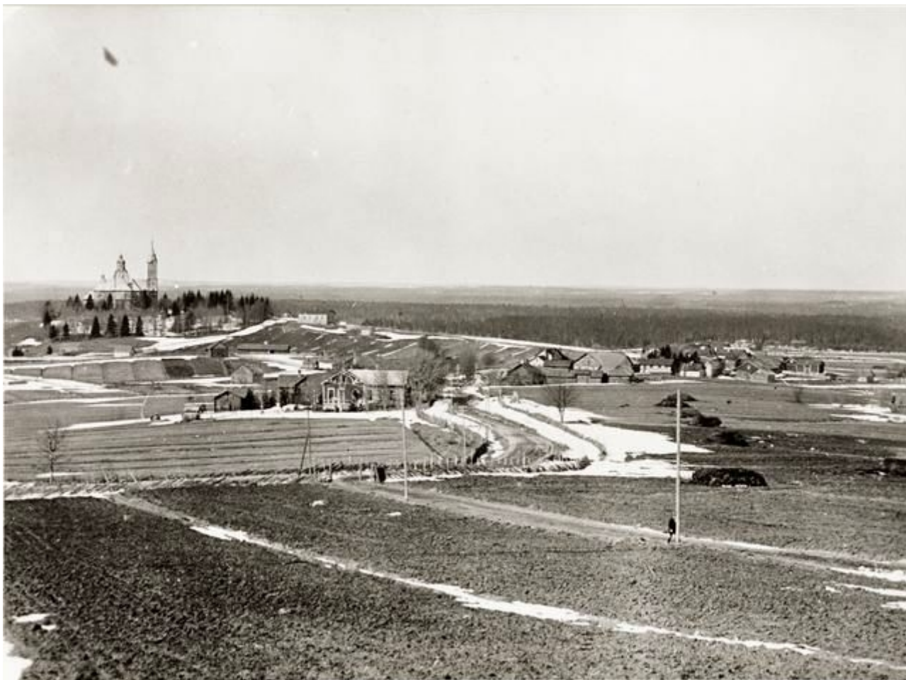
Kivennavan kirkonkylä valkoisten valtauksen jälkeen 21.4.1918.