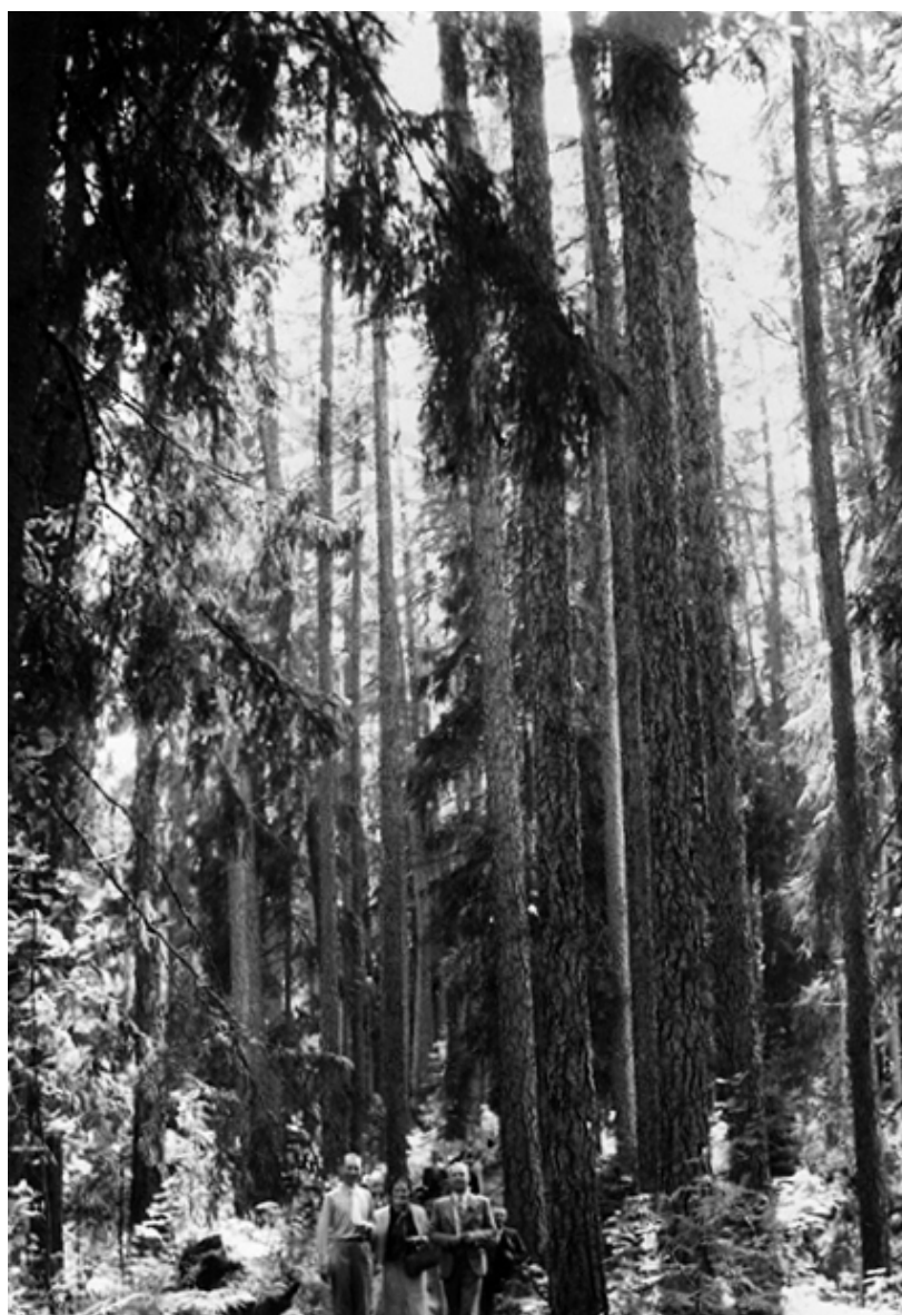
Raivolan lehtikuusimetsää , 1930-luku. Museovirasto. Historian kuvakokoelma.