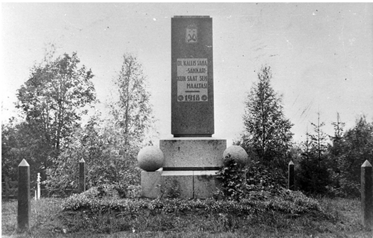
Kivennavan vuoden 1918 sankaripatsas, 1920-30-luku.