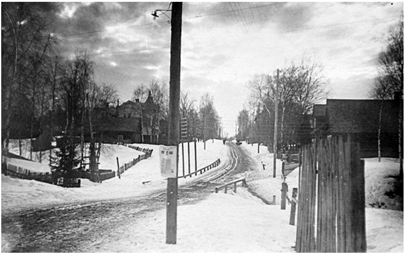
Talvinen näkymä Raivolassa, 1930-luku.