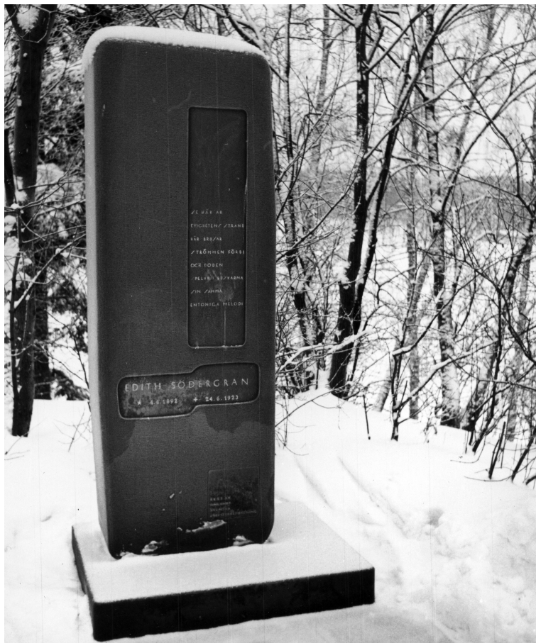
Edith Södergransin muistokivi Raivolassa, joulukuu 1988.