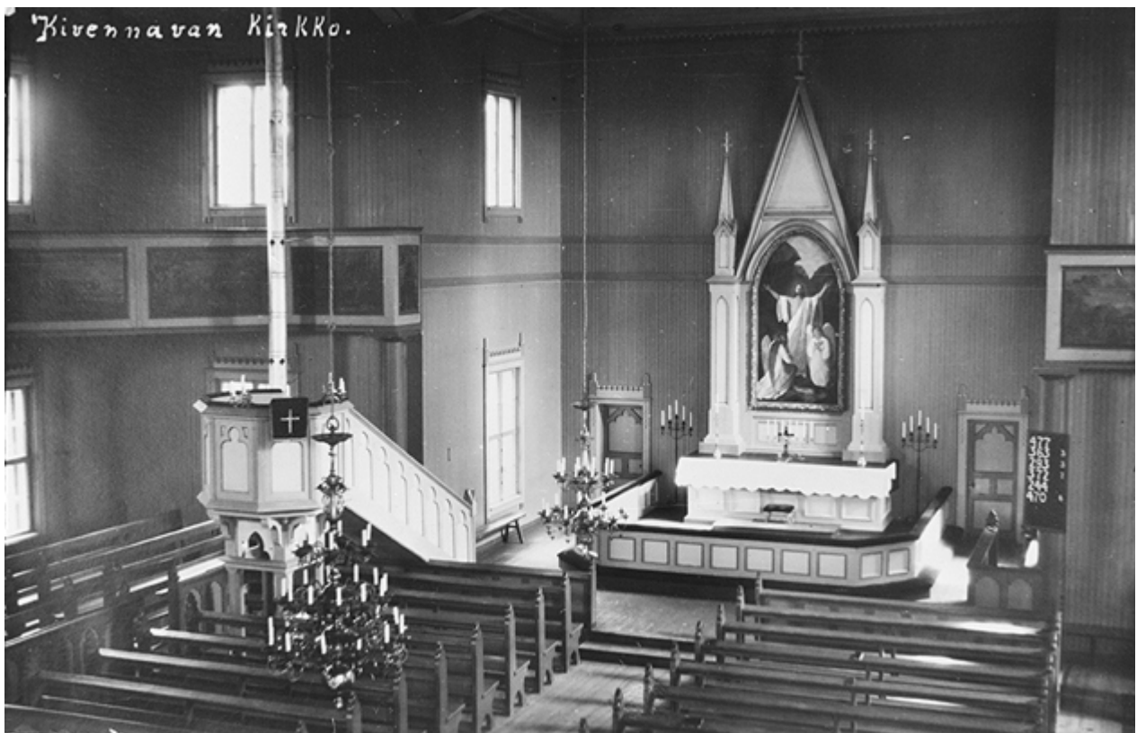
Sisäkuva Kivennavan kirkosta 1920-30-luvulla.