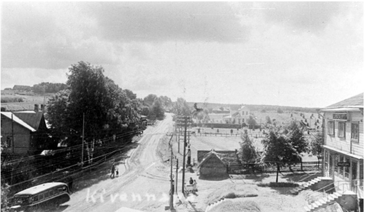
Kivennavan kirkonkylä, 1930-luku.