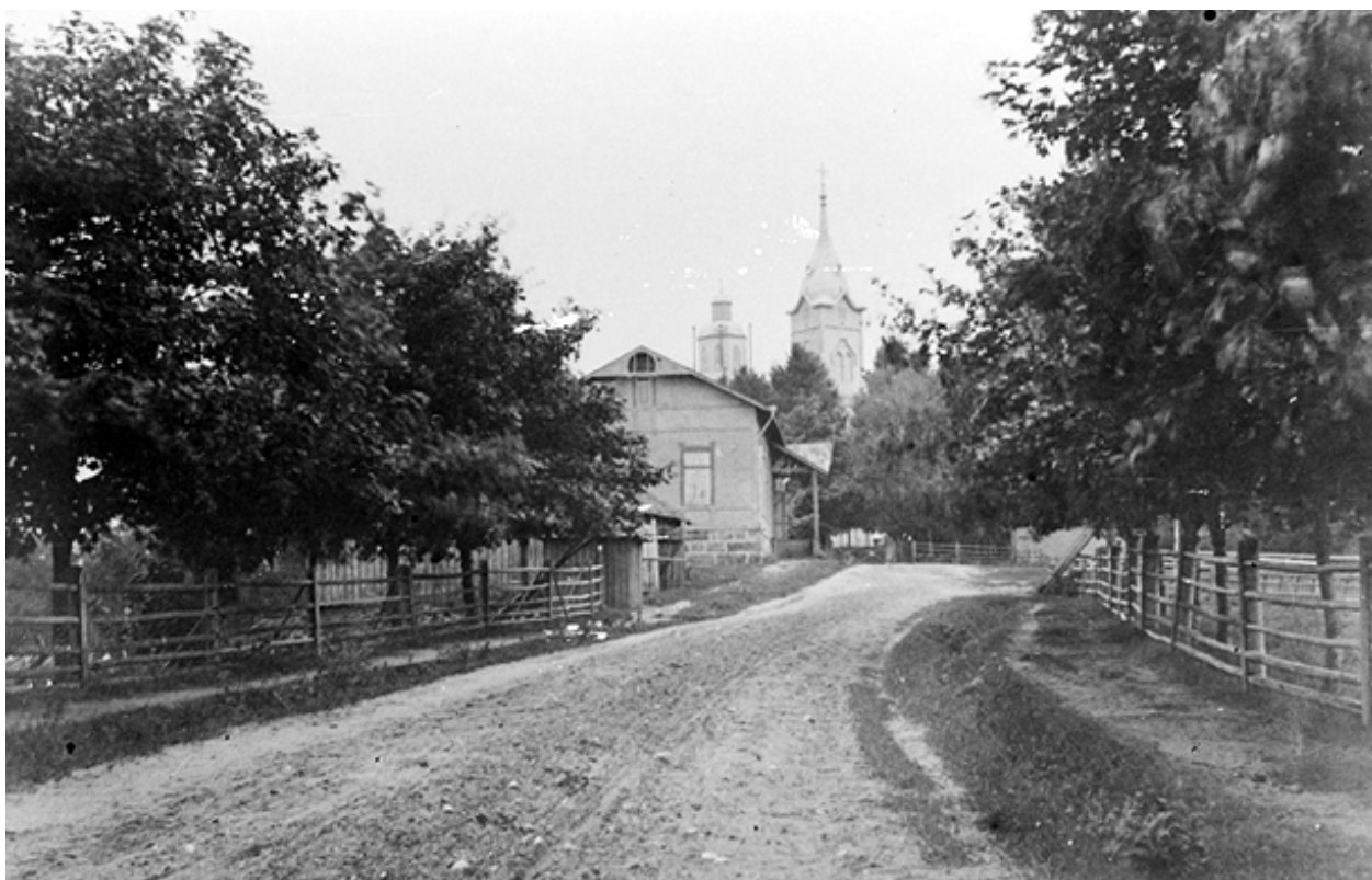
Kivennavan kirkko ja seurakuntatalo, 1920-30-luku.