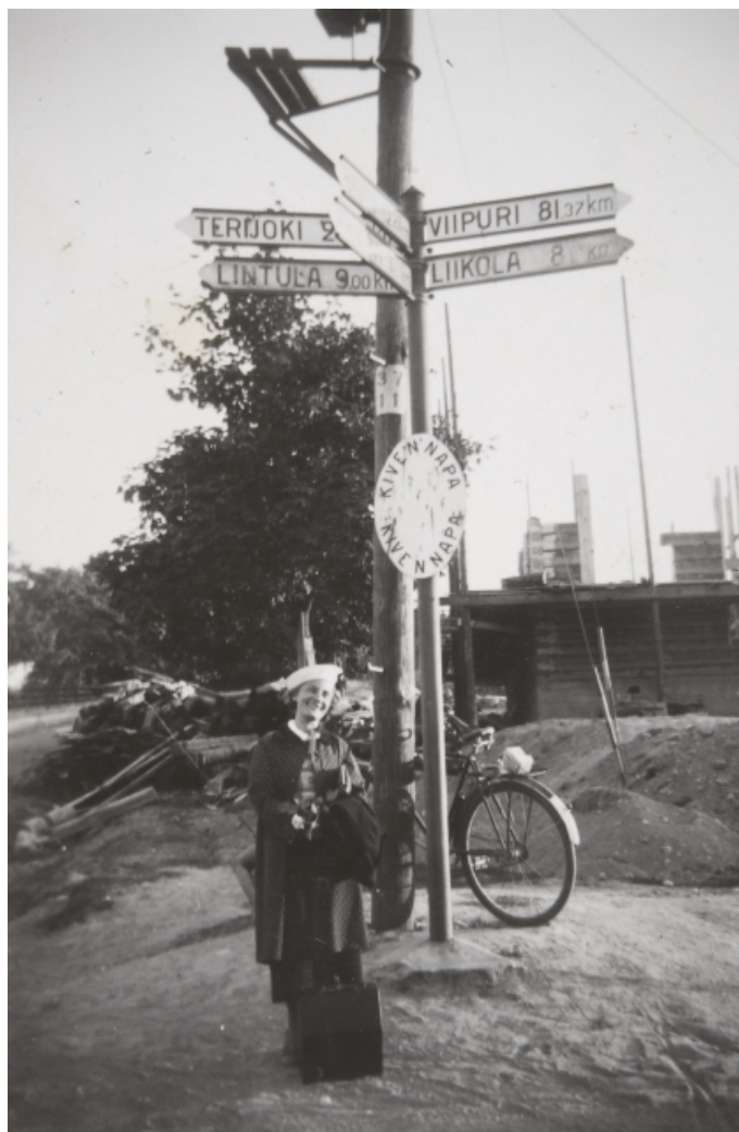
Kirjailija Helvi Hämäläinen lähdössä Kivennavalta elokuussa 1938.